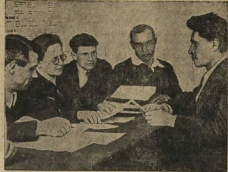
На СЕССИИ... (Caption describing the person in the image)

СНХ ССР вынесла решение провести в составе Коммунистической партии ЦК ВКП(б) и СНК Союза ССР выборы в состав ЦК ВКП(б) и СНК Союза ССР в составе Коммунистической партии ЦК ВКП(б) и СНК Союза ССР.