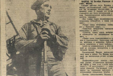
МАДРИД, 20 Октября. Газета «Известия», Москва. Солдаты правительственных войск в атаке на позиции фашистских войск в Овьедо. В центре — командир роты правительственных войск, в окружении солдат.