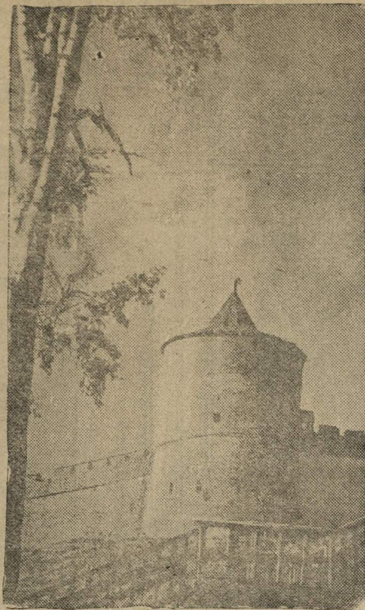
Город Горький. Кремлевская башня.