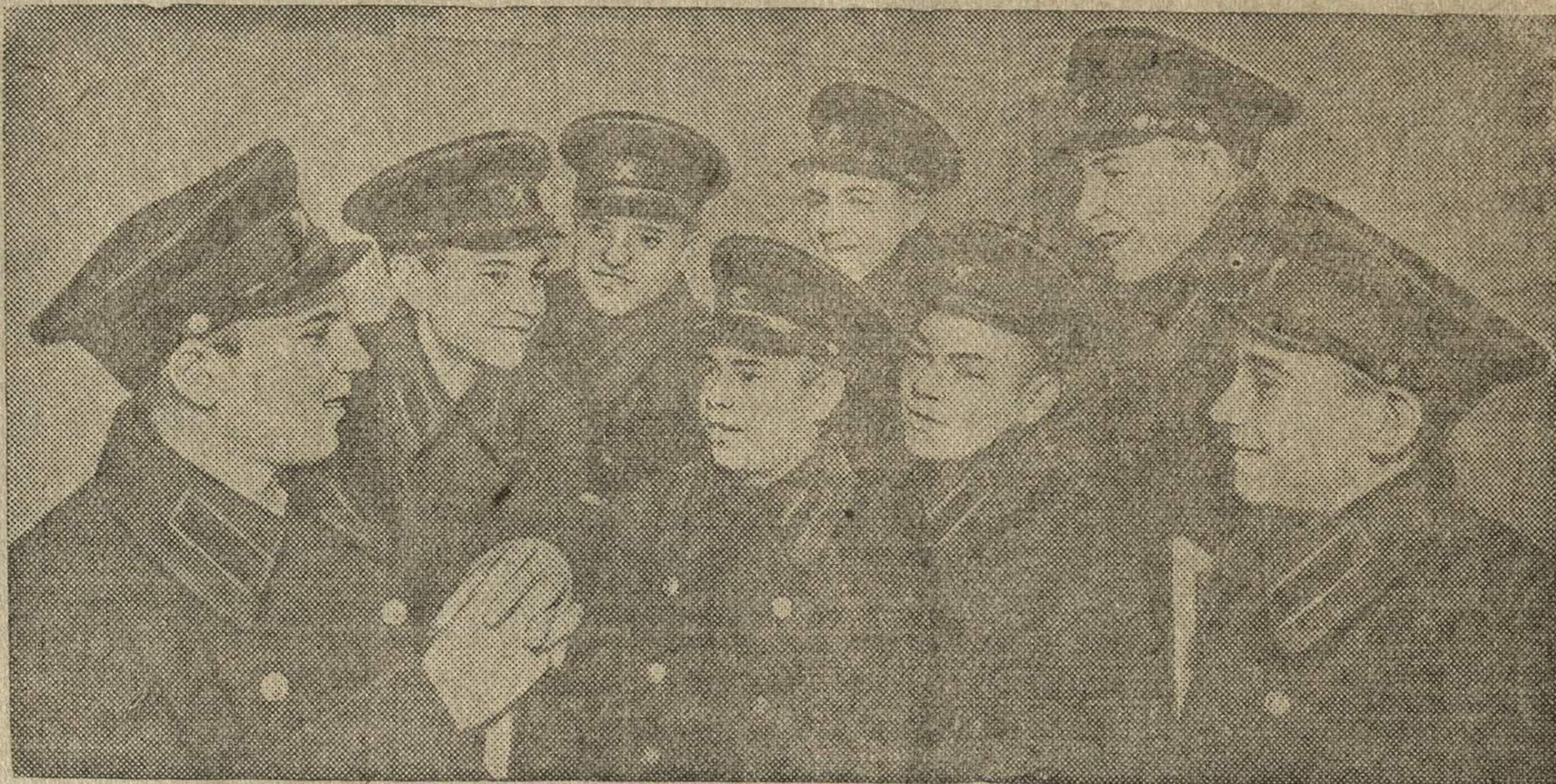
Группа учеников ремесленного училища № 7 при заводе „Динамо“ имени С. М. Кирова (Москва).

ТАСС уполномочен опровергнуть это сообщение, как вымышленное.