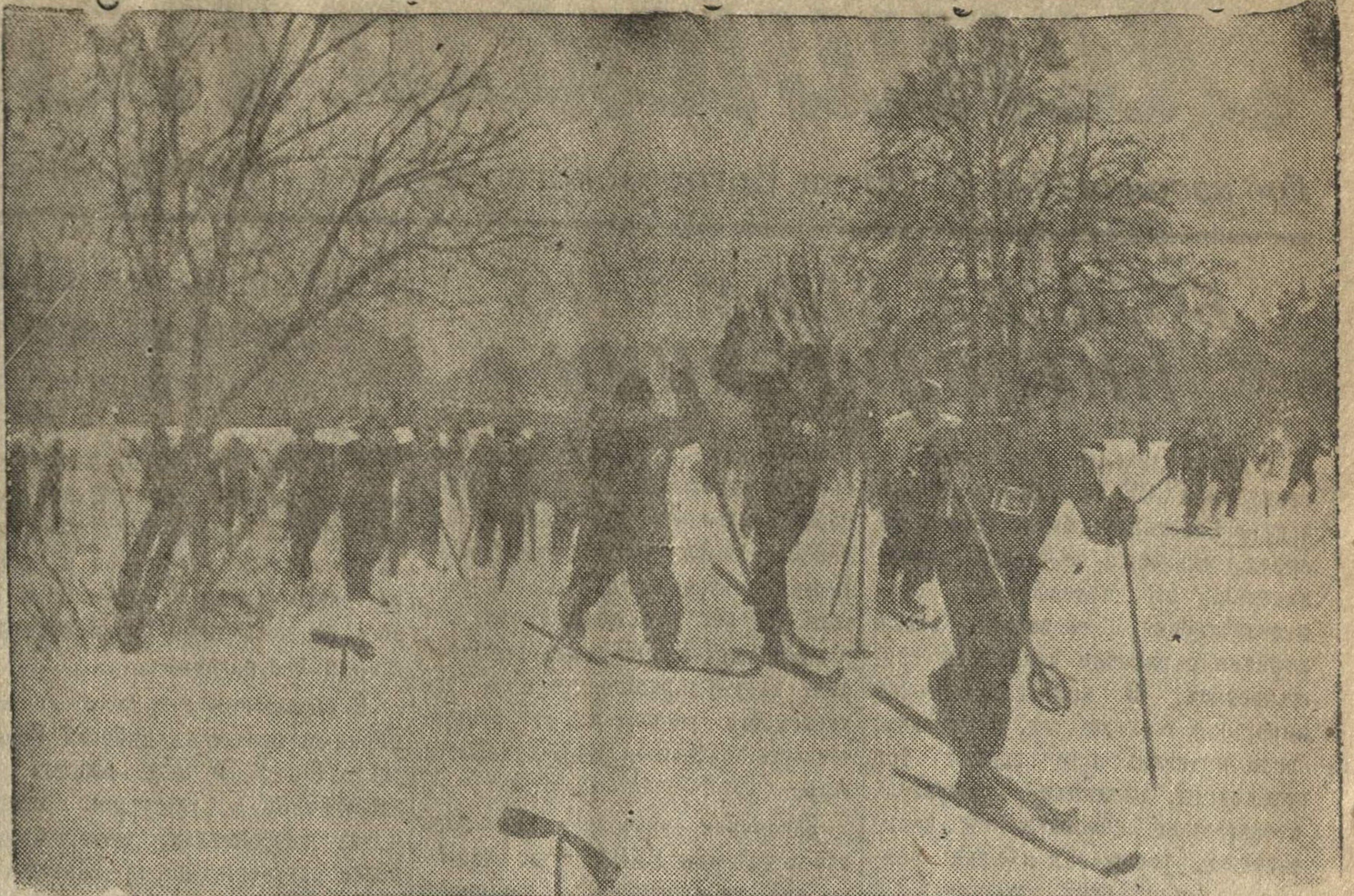
Традиционная лыжная эстафета имени В.П. Чкалова, в городе Горьком. На снимке: старт мужских команд.