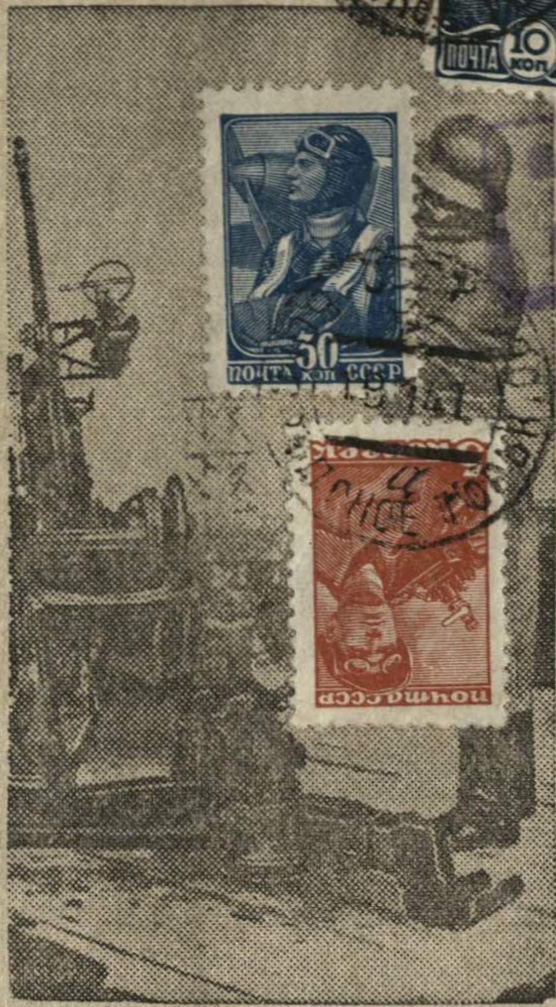
Германское легкое зенитное орудие на бельгийском побережье в районе Остенде.