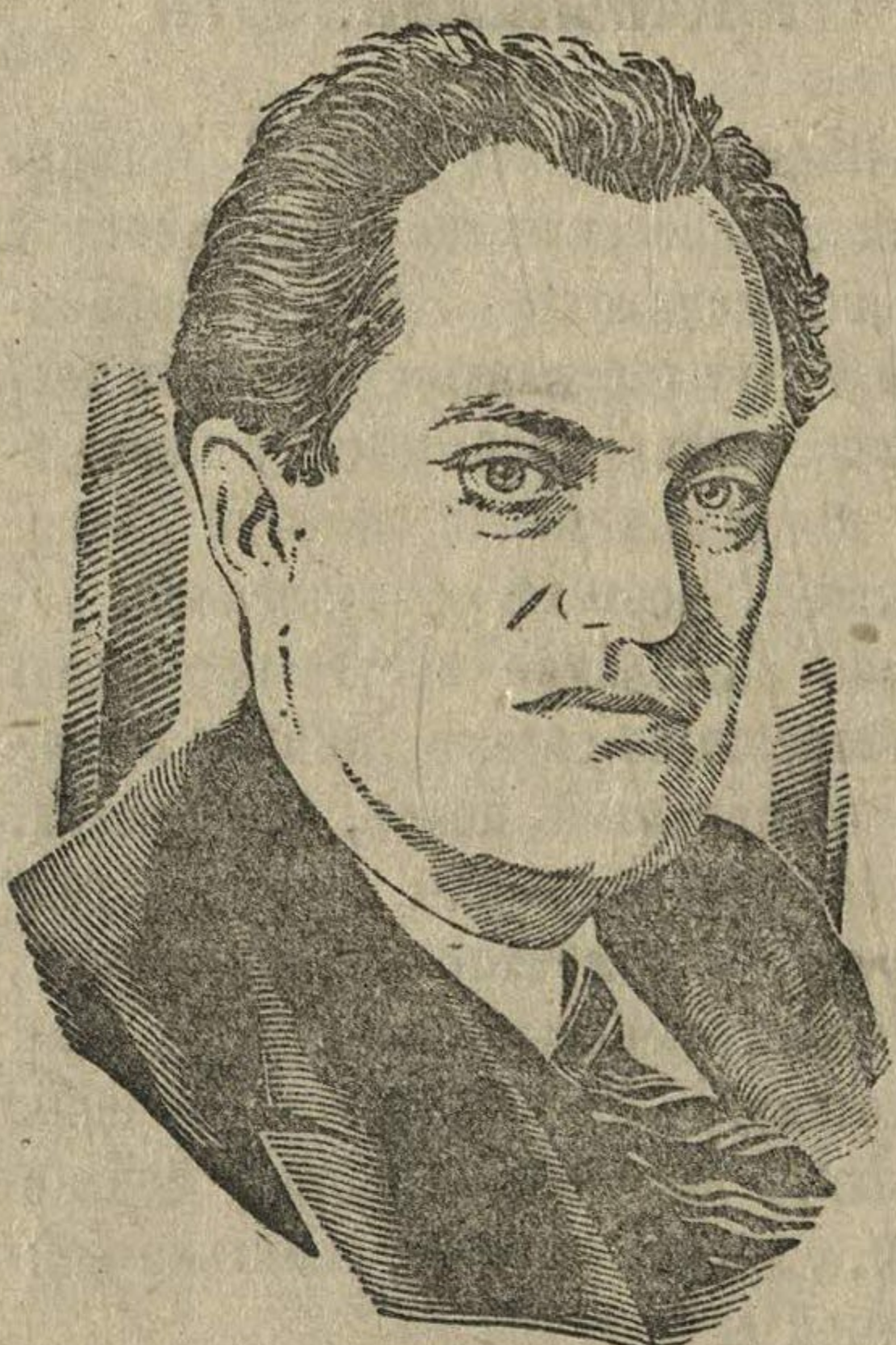
В. В. Куйбышев. Рис. К. Теодоровича.

ального ленинского плана ГОЭЛРО. Первые крупные советские электростанции — Волховская, Шатурская, Каширская, Кизеловская — были построены и пущены в ход при участии В. В. Куйбышева.