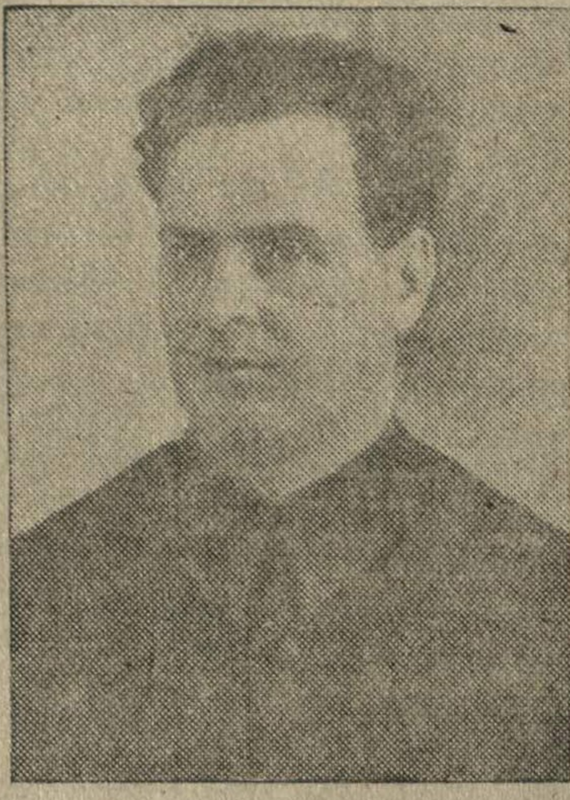
МОДЕСТ ТИХОНОВИЧ ТРЕТЬЯКОВ,

секретарь Горьковского обкома и горкома ВКП(б), избранный депутатом Совета Союза Верховного Совета СССР по Горьковскому-Ленинскому избирательному округу № 116.