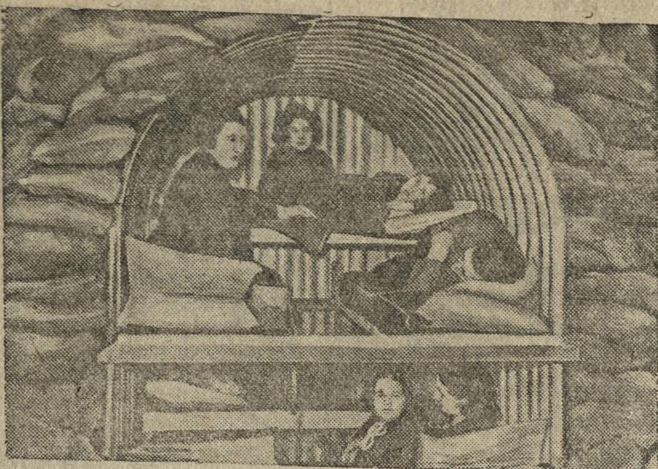
Внутренний вид бомбоубежища Андерсона в Англии.

Бывший председатель Индийского национального конгресса