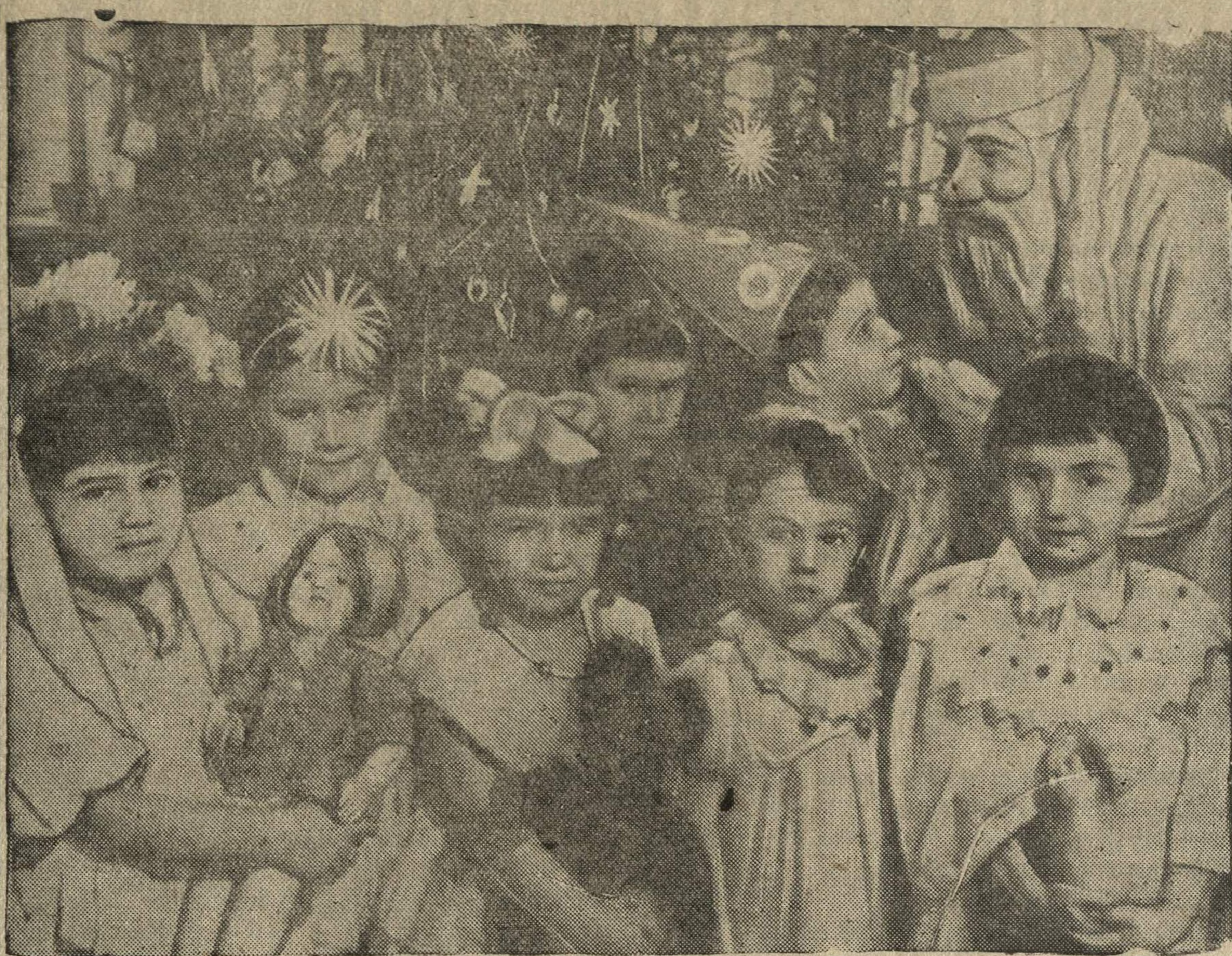
В детском саду № 136 Верхне-Волжского речного пароходства.

По словам представителя государственного департамента США, 24 января Рузвельт заверил нового английского посла в США Галифакса в том, что Соединенные Штаты решили „продолжать оказание помощи Англии во все возрастающих размерах и предоставить в распоряжение Англии военные материалы, поступающие в настоящее время от быстро расширяющейся промышленности США“.