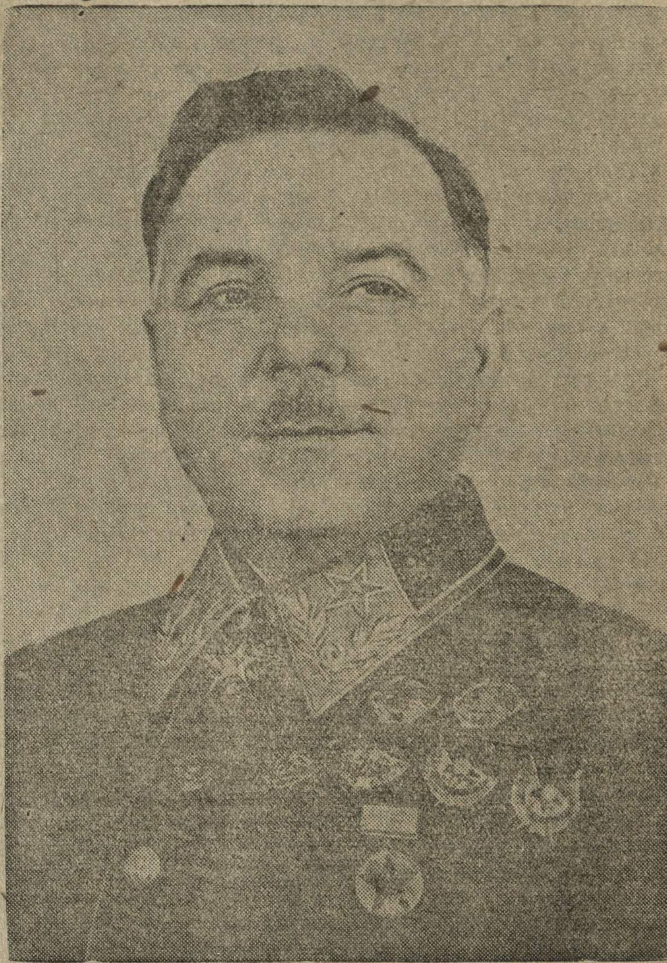
Заместитель Председателя СНК СССР Маршал Советского Союза К. Е. Ворошилов.

Горячо поздравляя Климента Ефремовича с днем его 60-летия, рабочие, крестьяне, интеллигенция, бойцы и командиры Красной Армии, — весь советский народ, — желают ему долгих лет жизни и здоровья, — на радость трудящимся.