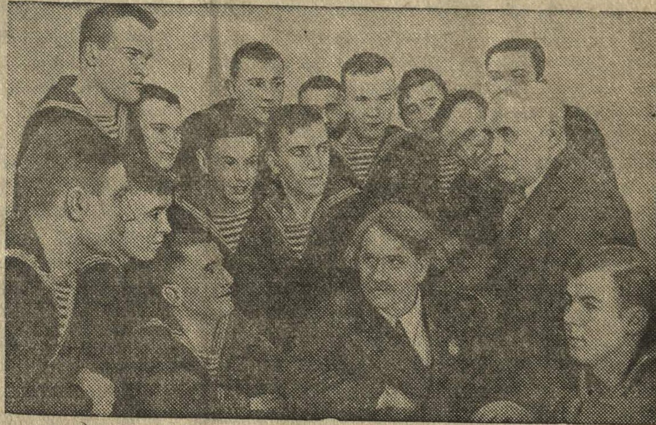
Писатели-орденоносцы С. С. Сергеев-Ценский и А. С. Новиков-Прибой среди курсантов Высшего военно-морского ордена Ленина Краснознаменного училища имени М. В. Фрунзе (Ленинград).