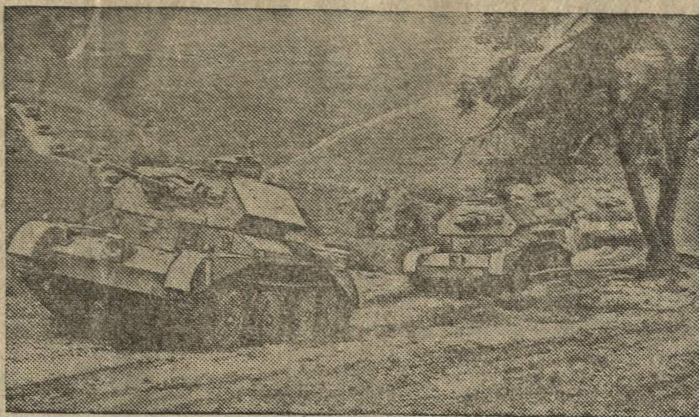
Английские тяжелые танки в походе.

В Абиссинии суданские части продвигаются в районе Голубого Нила.