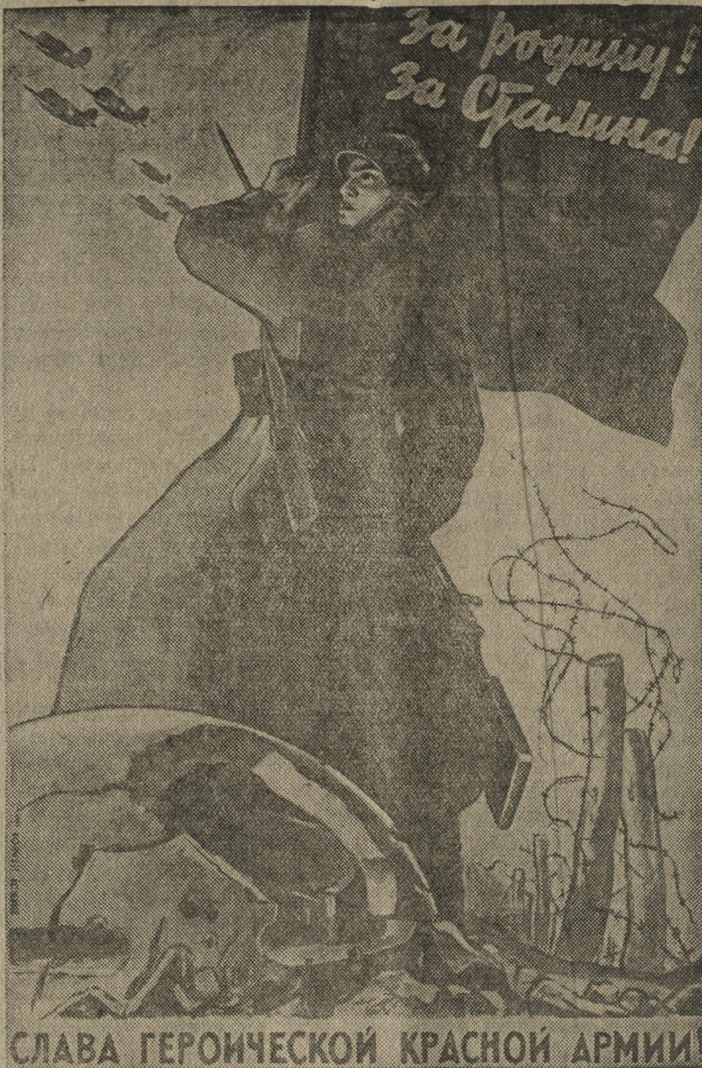
СЛАВА ГЕРОИЧЕСКОЙ КРАСНОЙ АРМИИ!