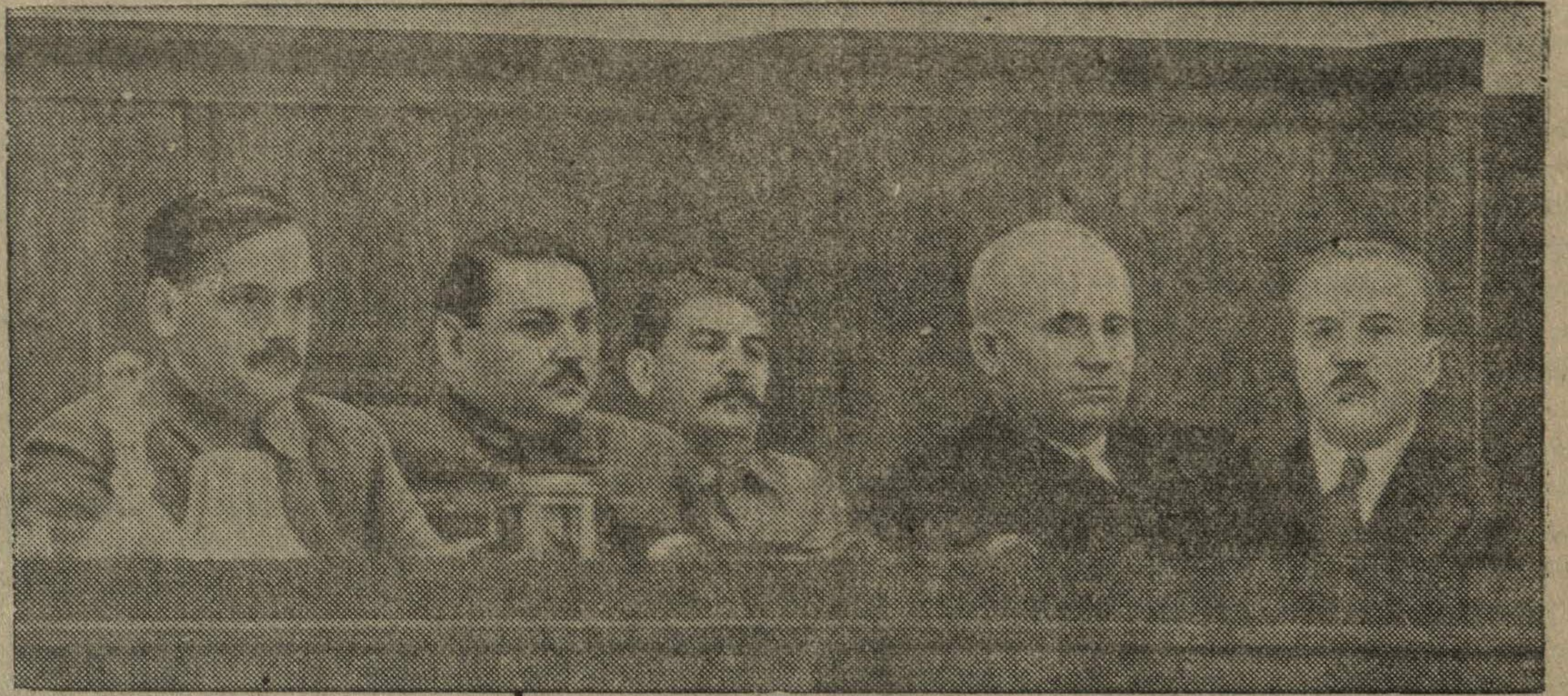
Товарищи А. А. Андреев, А. А. Жданов, И. В. Сталин, Н. С. Хрущев и В. М. Молотов в президиуме конференции.