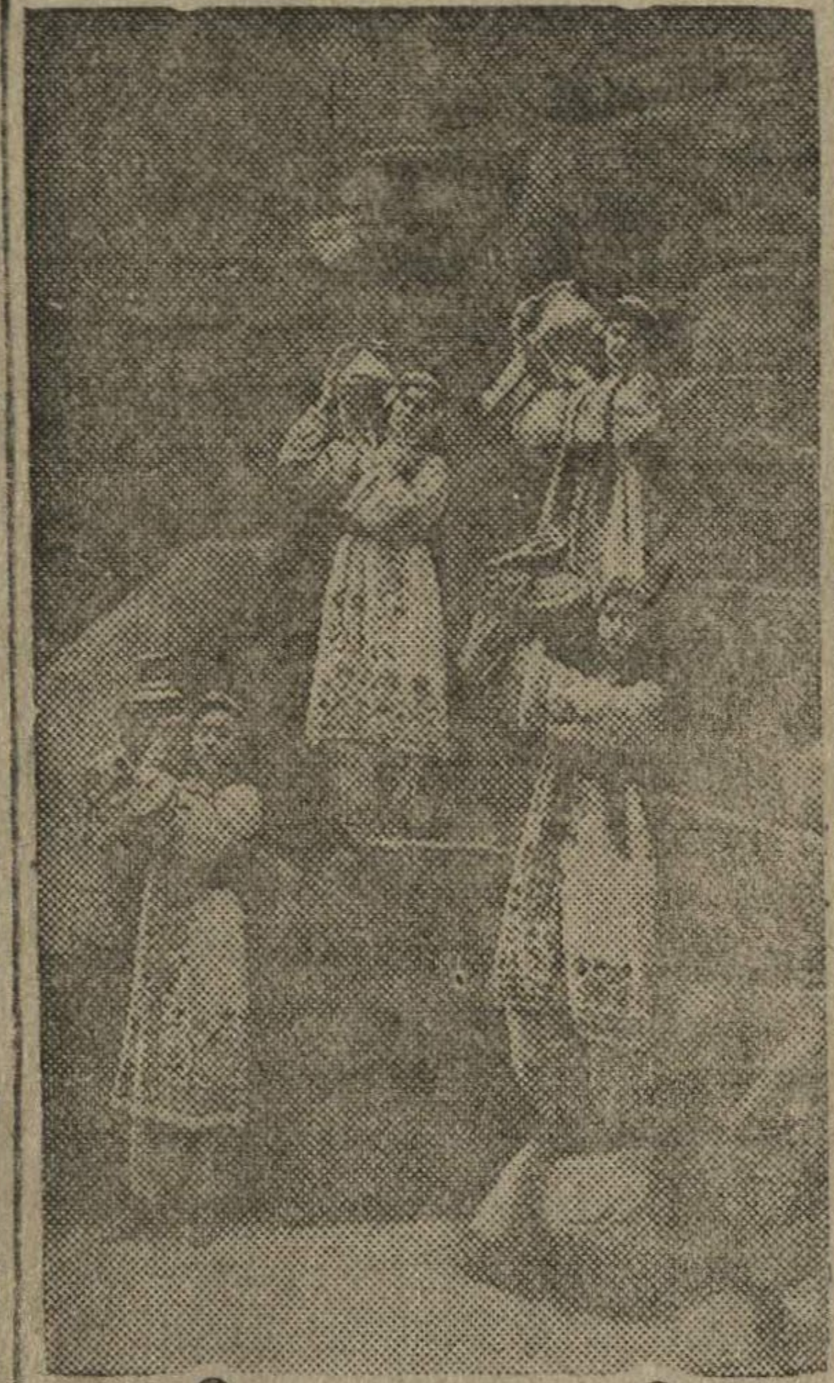
Сцена из 1-го акта музыкального представления „Пола“ в постановке Таджикского Государственного театра оперы и балета (Сталинабад).

Весной 1941 года в Москве будет проведена декада таджикского искусства. К декаде готовится ряд постановок: музыкальное представление „Пола“, оперы „Восстание Восе“ и „Кузнец Кова“, первый таджикский балет „Ду Гуль“, драма „Краснопотники“ и трагедия Шекспира „Отелло“.