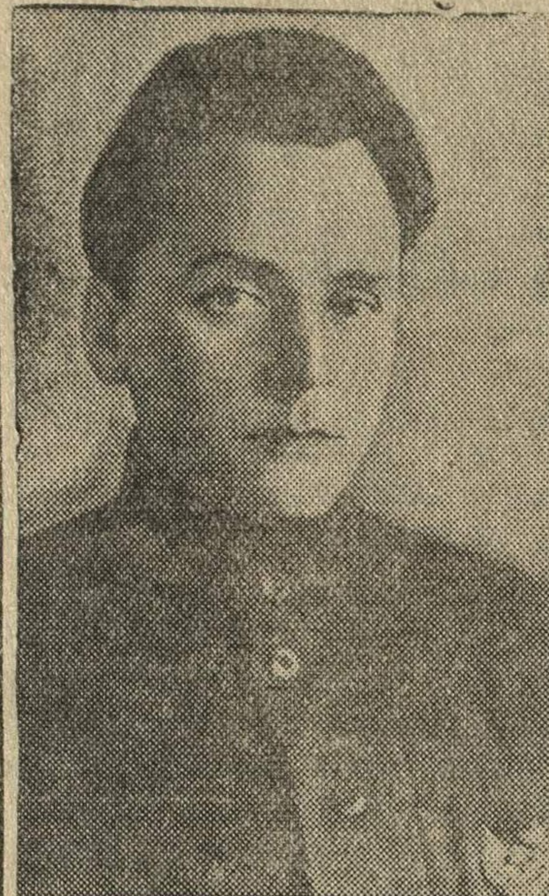
Д. А. Фурманов.

15 марта исполняется 15 лет со дня смерти талантливого советского писателя Д. А. Фурманова.