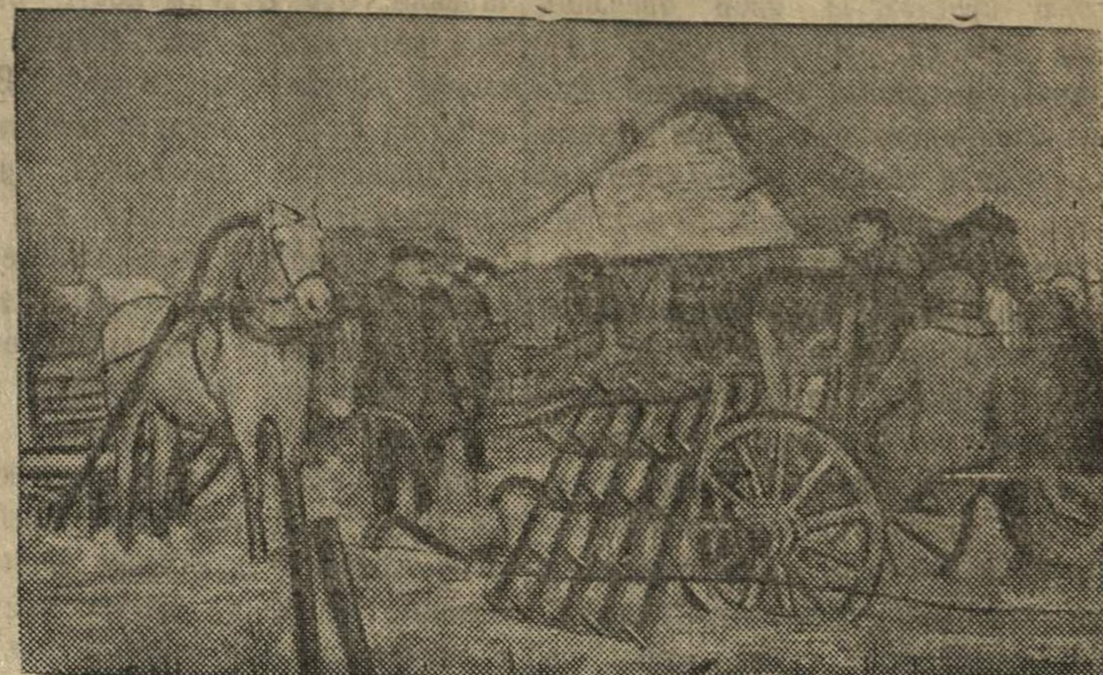
Приемка обобществленного сельхозинвентаря и лошадей правлением колхоза.

В деревне Слобода (Столбовский район, Барановичская область, БССР) организован новый колхоз „Перемога“. Колхозники приступили к обобществлению инвентаря, лошадей, кормов и семян, готовятся к весеннему севу.