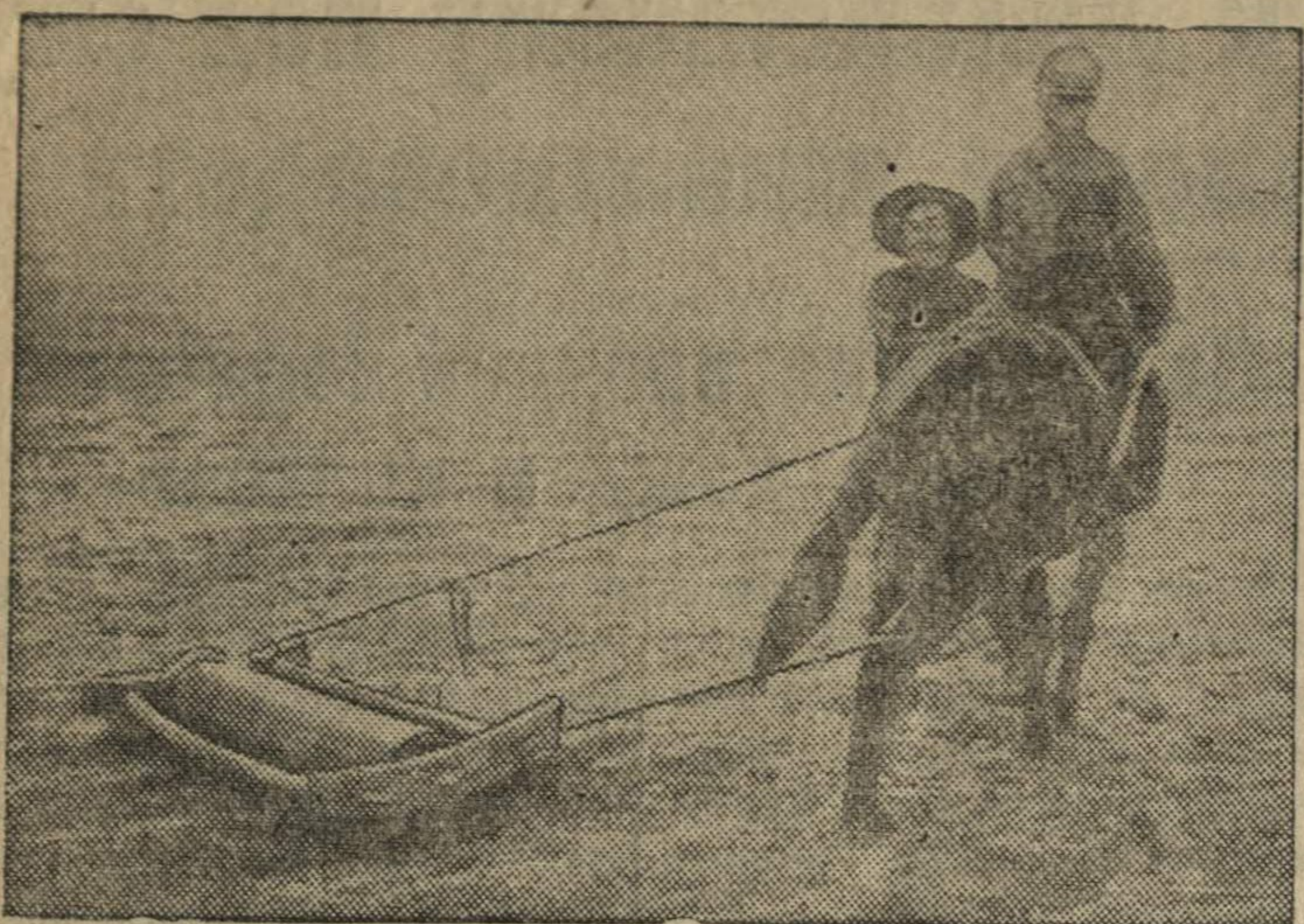
Манчжурский крестьянин на весенних полевых работах.