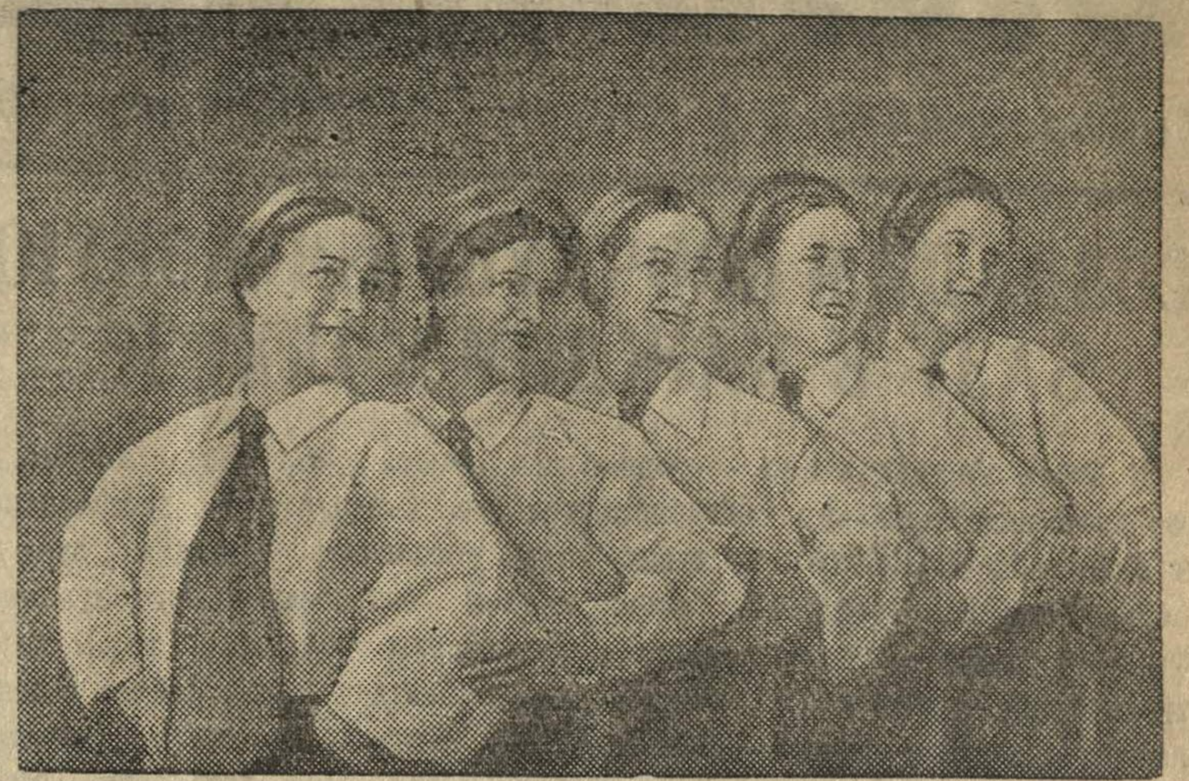
Экцентрический танец в исполнении балетного коллектива.