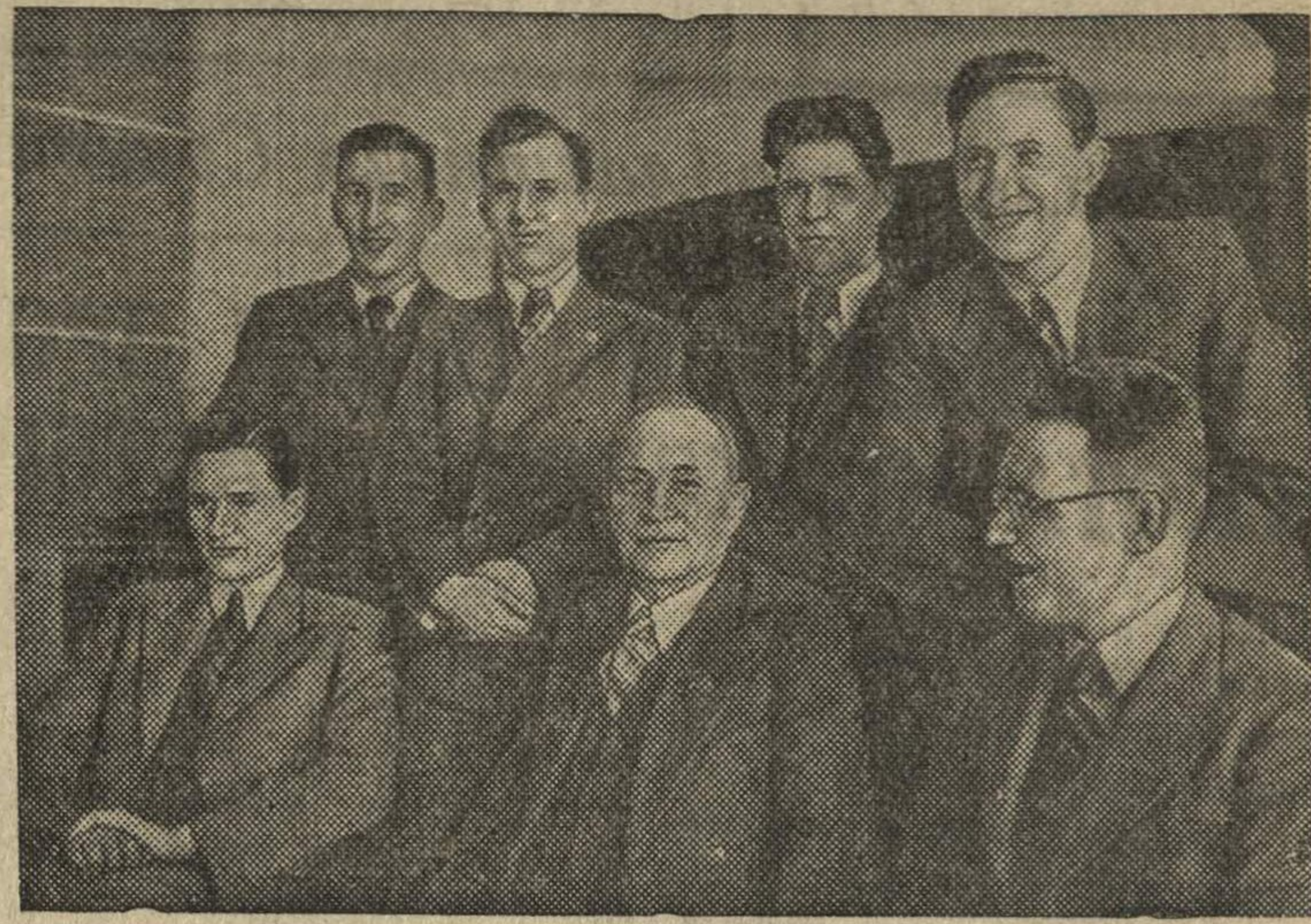
Тов. Куусинен среди участников турнира (слева направо): в первом ряду — П. Керес, О. Куусинен, М. Ботвинник; во втором ряду — И. Вондаревский, И. Болеславский, А. Лиленталь и В. Смыслов.

6-го апреля шахматный турнир в Ленинграде посетил Заместитель Председателя Президиума Верховного Совета СССР и Председатель Президиума Верховного Совета Карело-Финской ССР товарищ О. Куусинен.