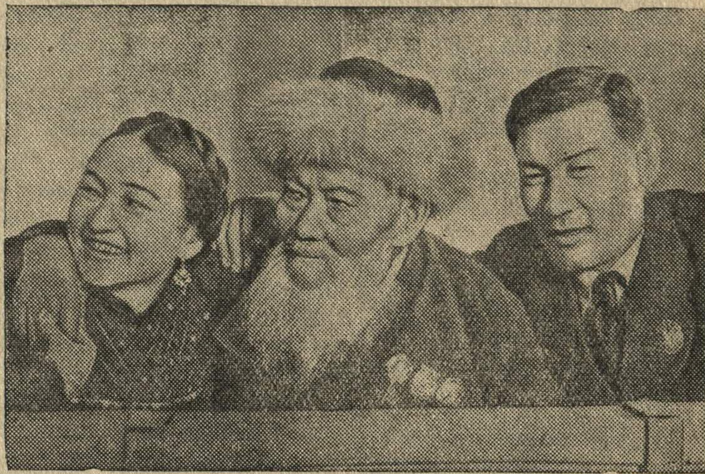
Лауреат Сталинской премии, трижды орденоседец Джамбул Джабаев (в центре), народная артистка СССР орденоседец Куляш Байсеитова и поэт орденоседец Т. Жароков.

(Передовая „Правды“ за 22 апреля 1941 г.)