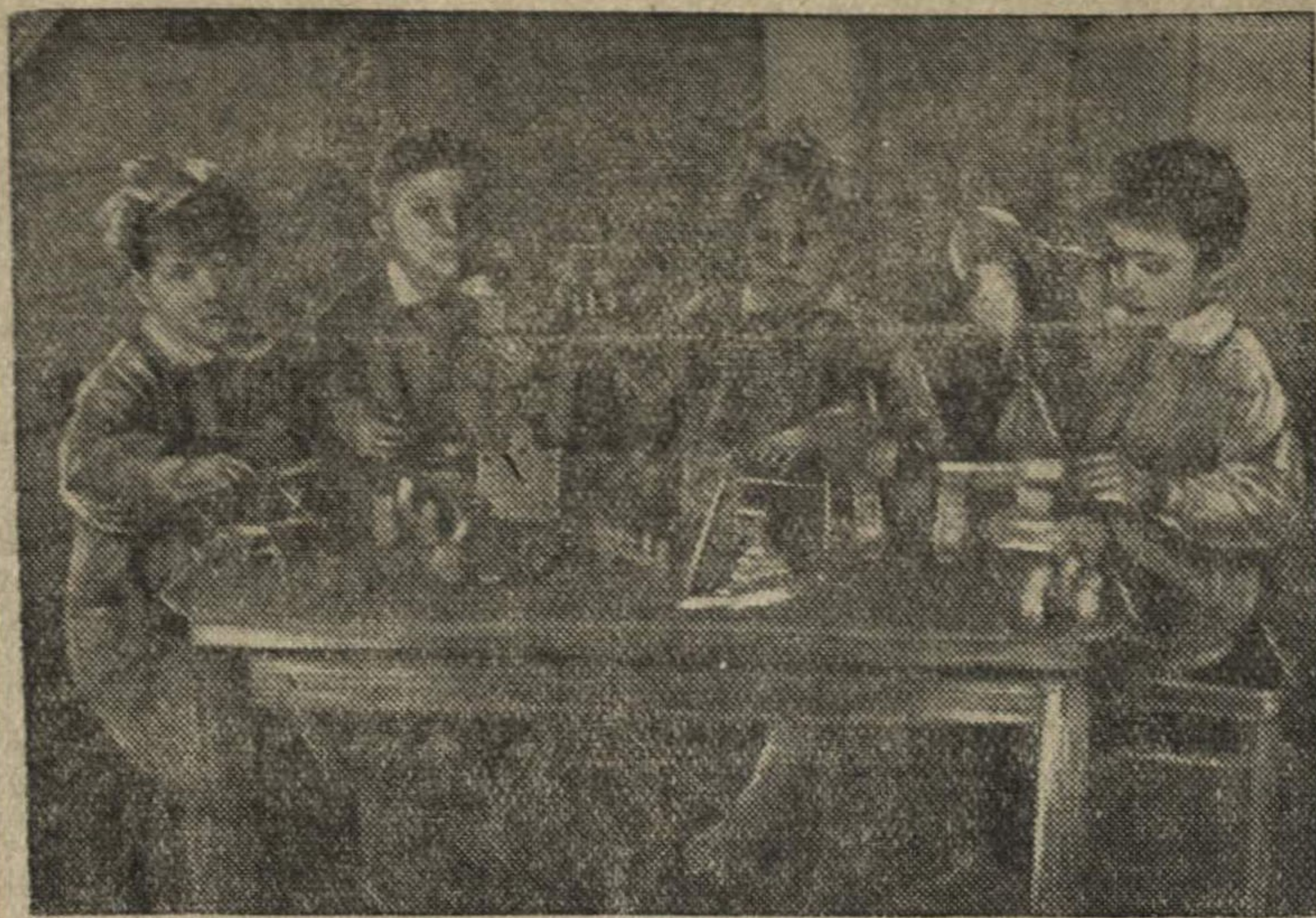
В детском саду завода имени Жданова.

Хорошо подготовиться к смотрю юных животноводов!