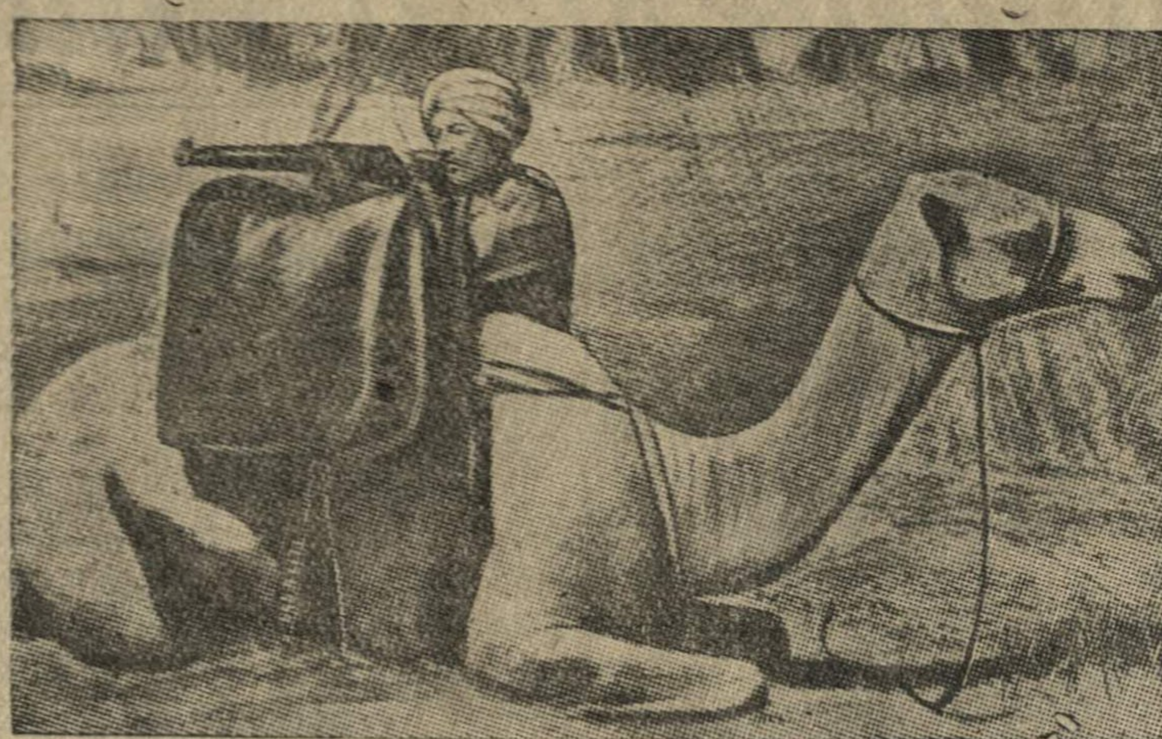
Верблюжий дозор суданских войск на эритрейской границе.