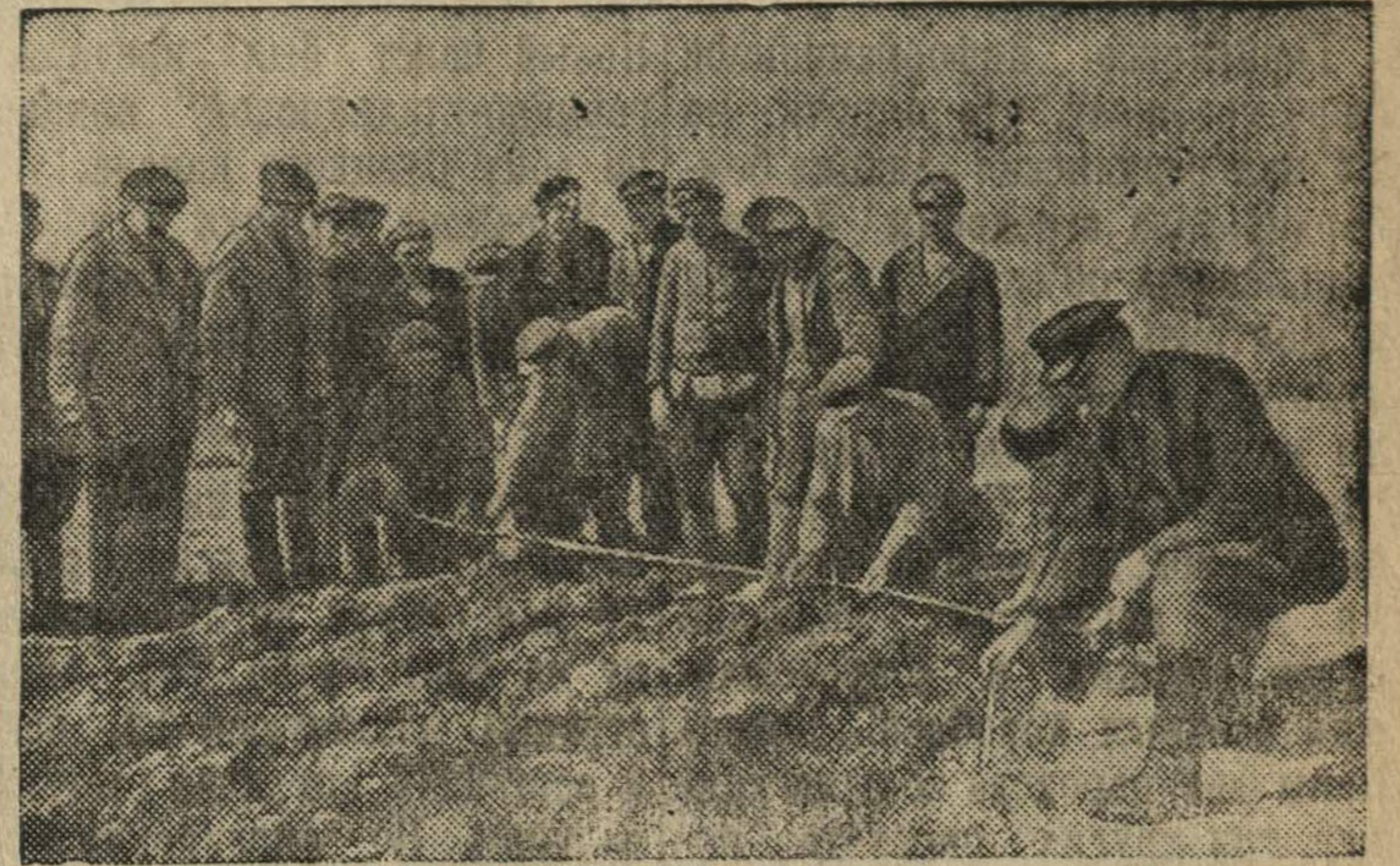
Здесь только что прошел советский трактор с пятилемешным плугом. Трудовые крестьяне впервые видят борозду такой ширины — почти 2 метра.