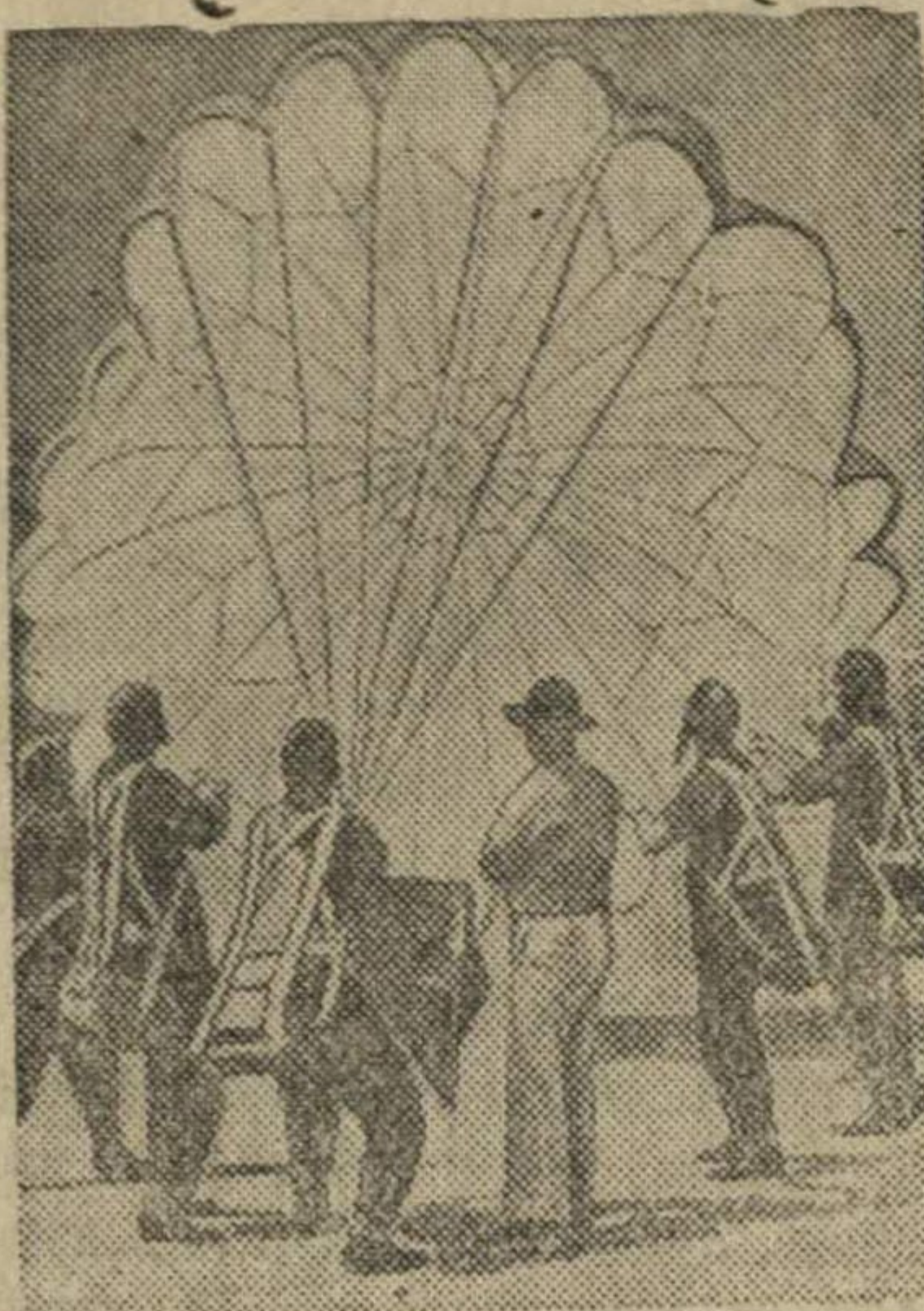
Обучение парашютистов приемам владения парашютом в момент приземления.