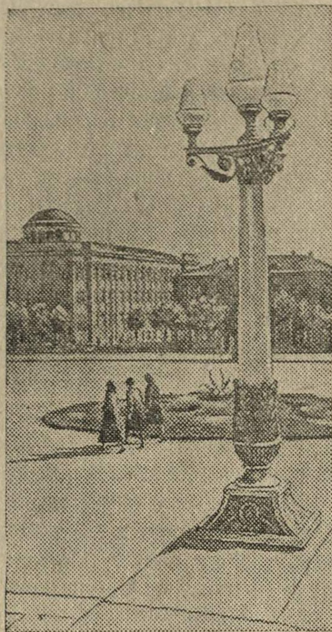
На центральной площади в г. Ереване (Армянская ССР).