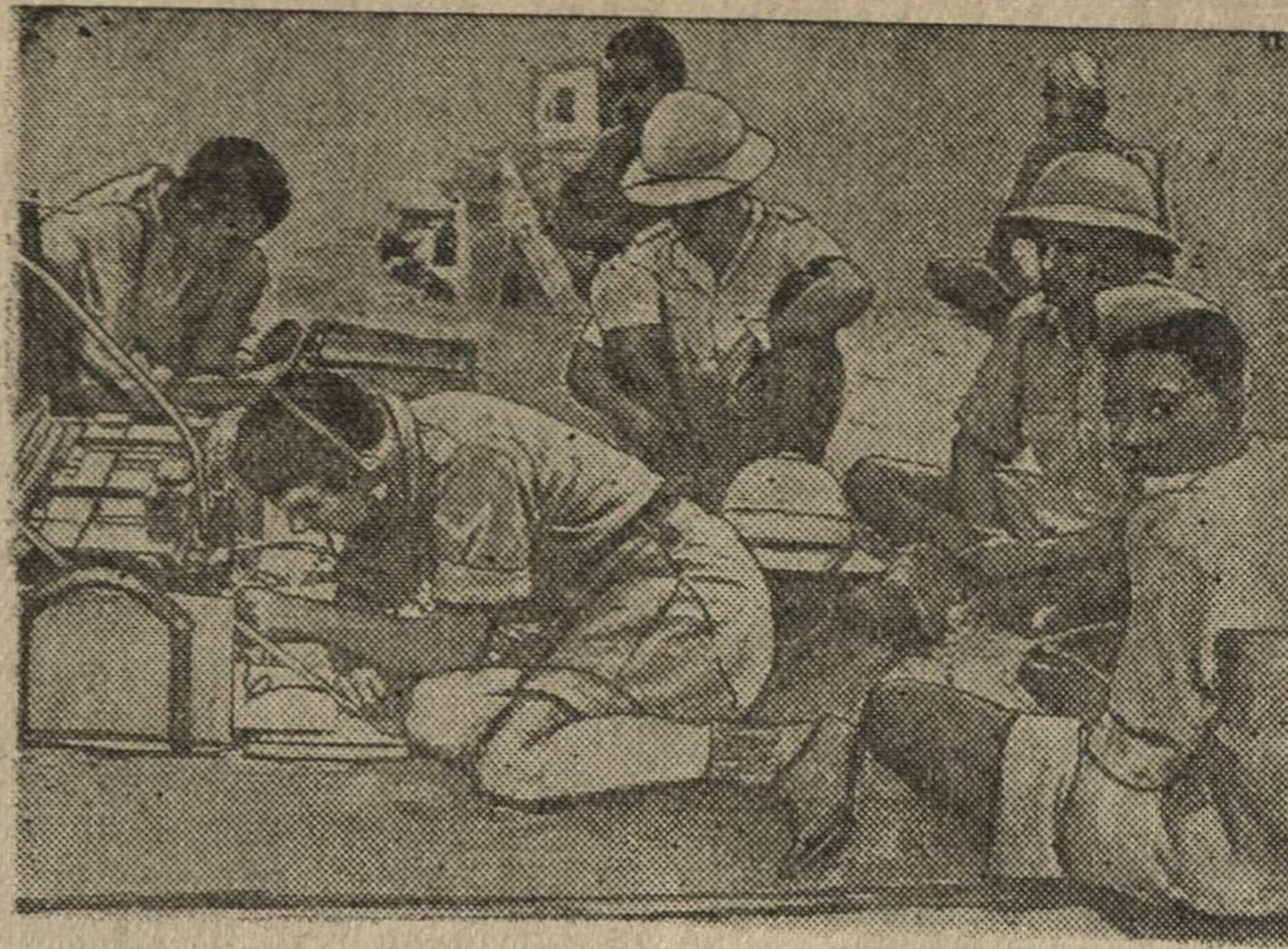
Полевая радиостанция абиссинских партизан.

Протест датского правительства, без ведома которого его посланник в США Кауфман подписал соглашение о Гренландии, не изменил положения. Над Гренландией, величайшим островом, почти сплошь покрытым вечной ледяной броней, объявлен американский протекторат («покрови-