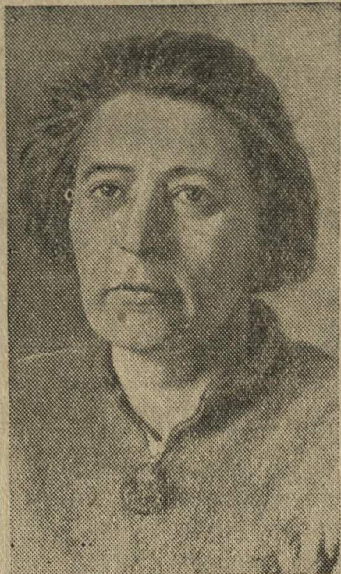
Анна Паукер — одна из активных деятелей рабочего движения в Румынии, долгое время находившаяся в заключении. В результате переговоров между правительствами СССР и Румынии т. Паукер освобождена из тюрьмы. Она прибыла в СССР и находится в Москве.

Работать сегодня лучше, чем вчера, а завтра лучше, чем сегодня! — в этом стремлении миллионов советских граждан ярко проявляется патриотизм нашего народа, его боевитость, его мобилизационная готовность.