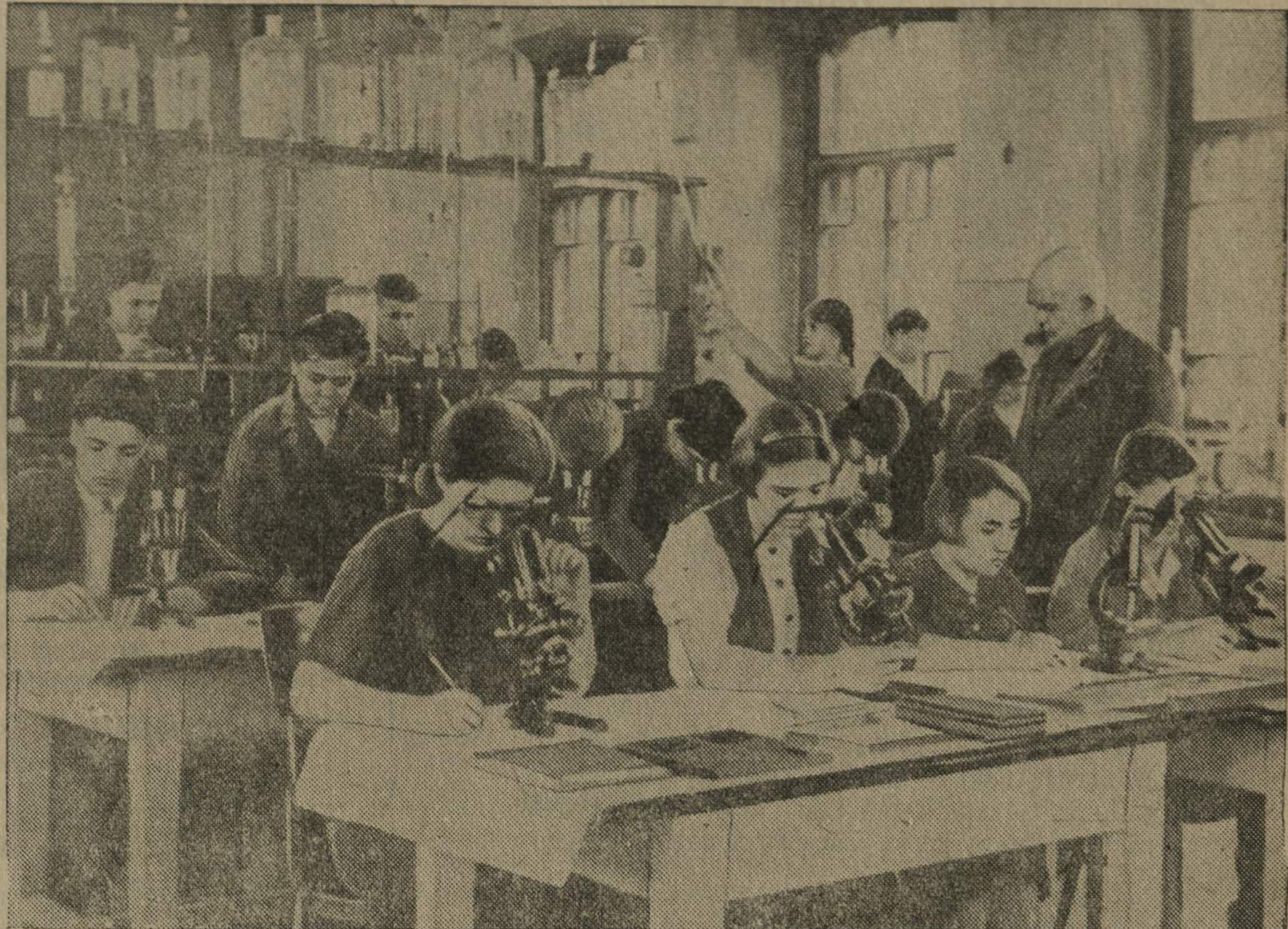
В Богородском кожевенном техникуме. Занятия студентов по гистологии кожи.

Школа, родители, профсоюзные и комсомольские организации общими силами обязаны организовать разумный отдых детей, сделать их каникулы живыми и интересными. Каникулы школьников должны пройти в полезных занятиях, чтобы ребята вернулись осенью в школы окрепшими, дружными, трудолюбивыми и энергичными.