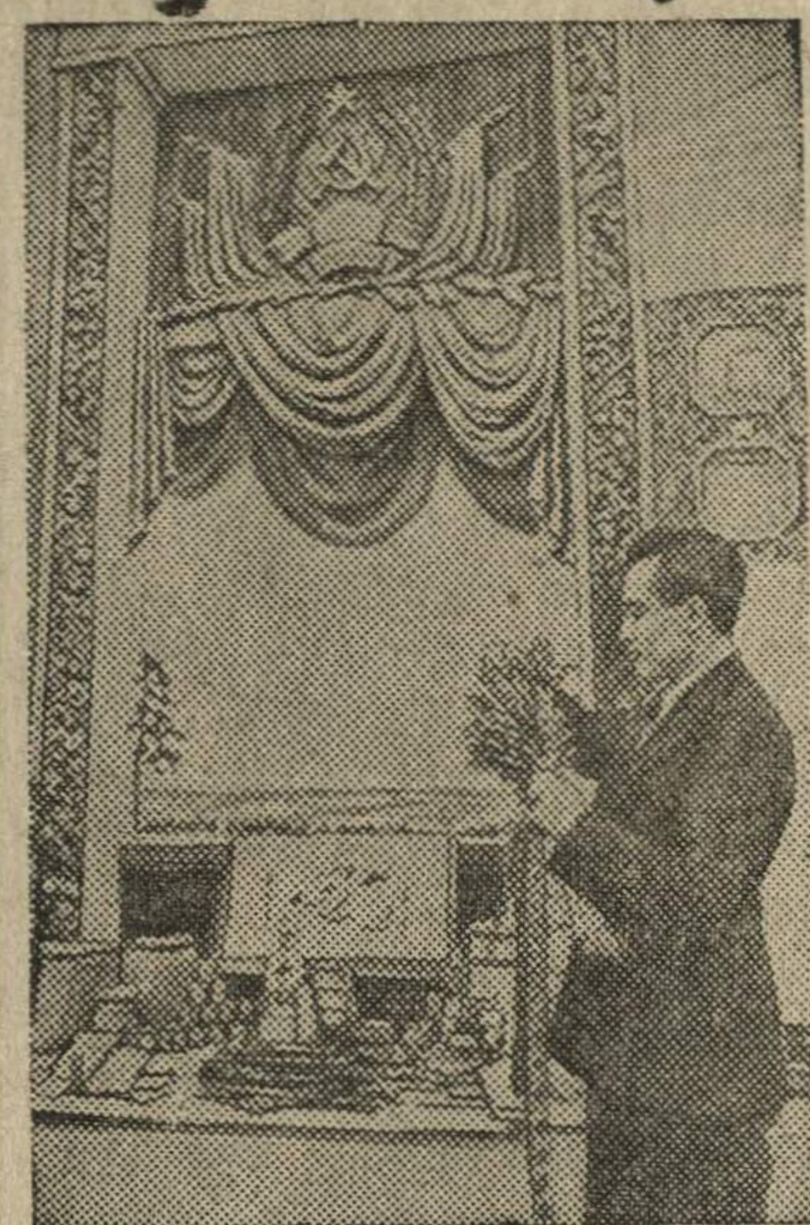
Эстонский художник Р. Ю. Паллас у эстонской ССР в павильоне Прибалтики.

Всесоюзная сельскохозяйственная выставка.