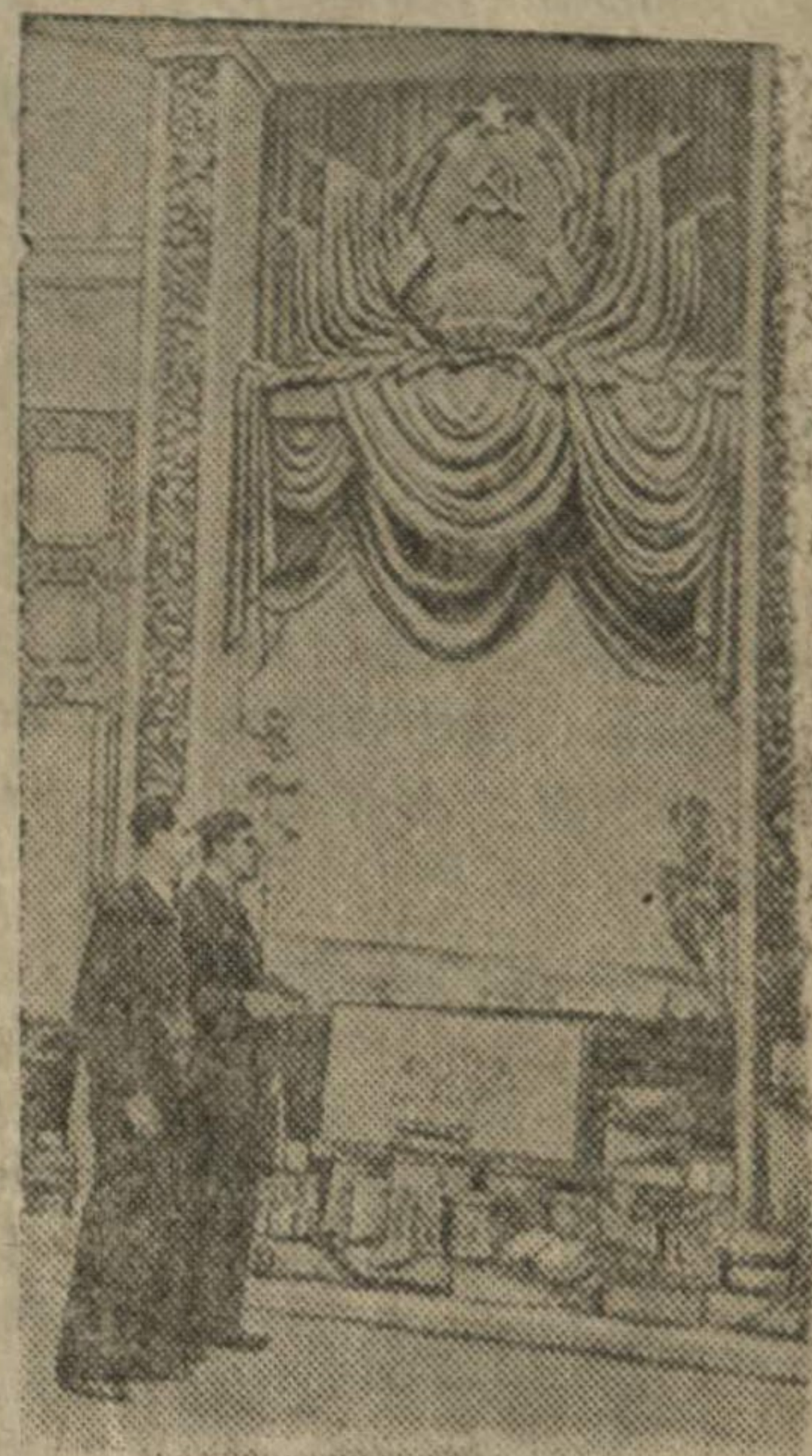
У стэнды Латвийской ССР в павильоне Прибалтики.

Всесоюзная сельскохозяйственная выставка 1941 г.