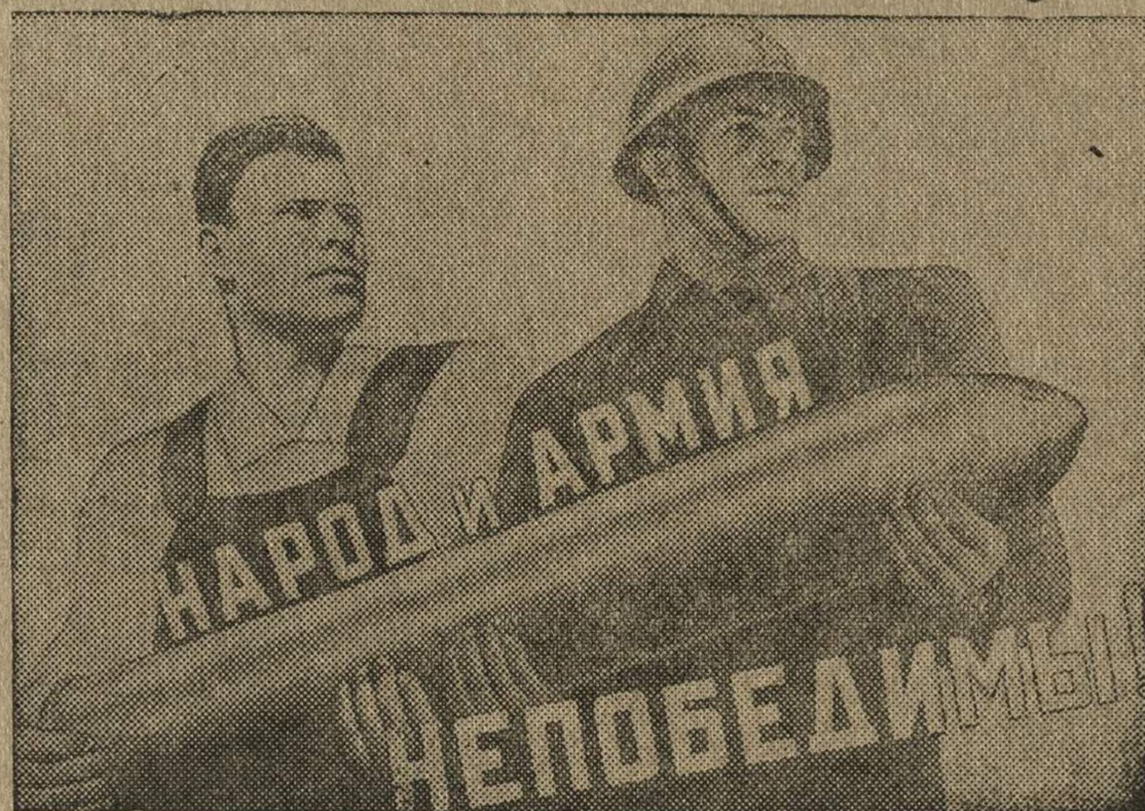
Рисунок художника В. Корецкого. (Репродукция с плаката, выпущенного издательством «Искусство»).