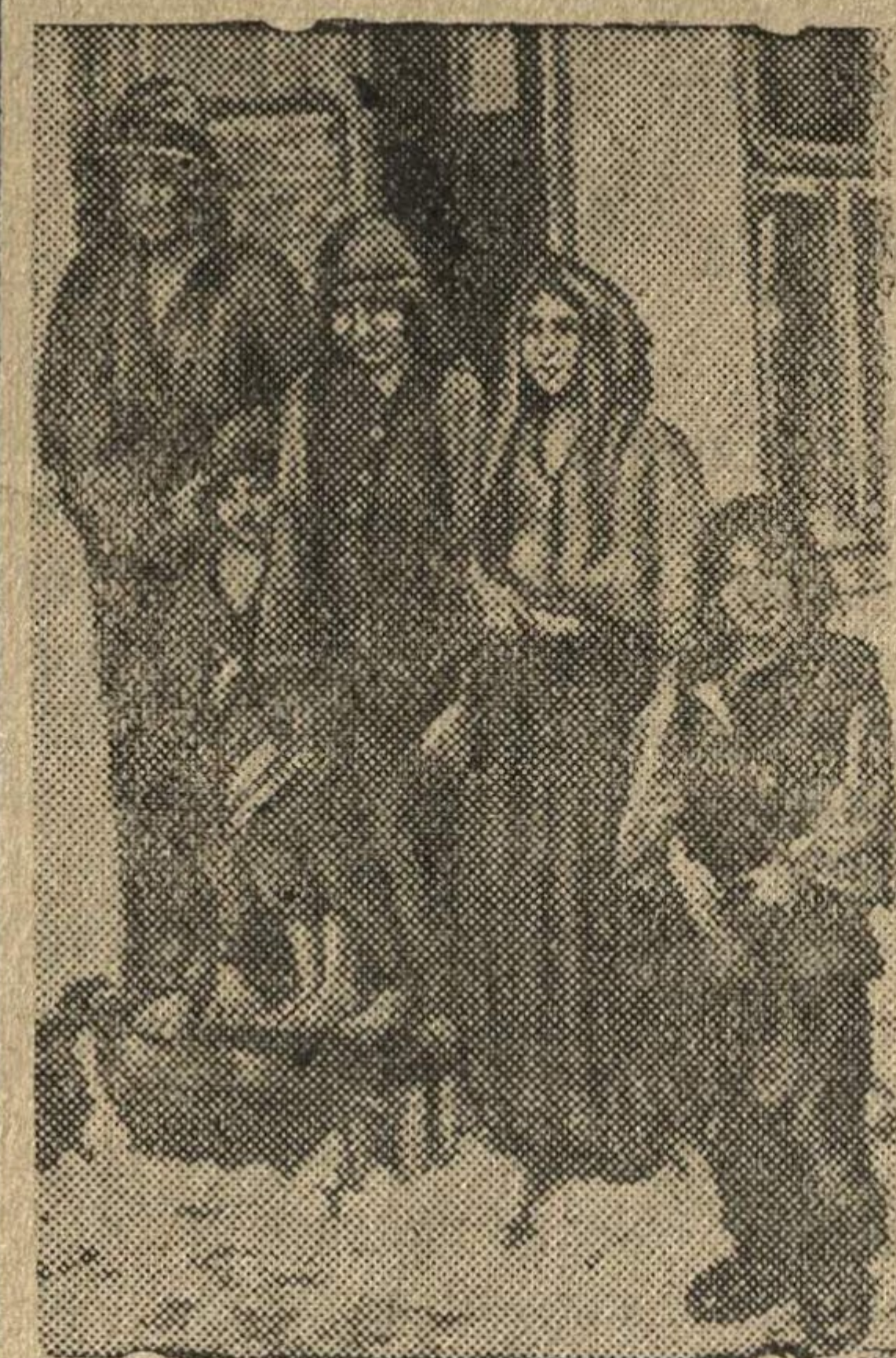
Доведенная до крайней нищеты румынская семья.

Румынские бояре довели румынский народ до полной нищеты и разорения. Население терпит голод, оно не имеет средств, чтобы купить одежду и обувь.