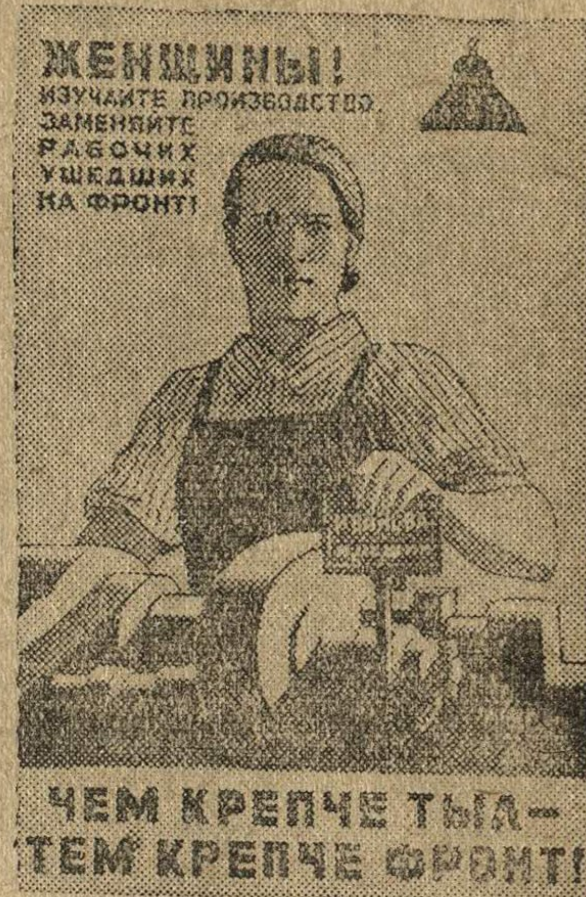
Рисунок художника О. Эйгес.

(Репродукция с плаката, выпущенного издательством „Искусство“).