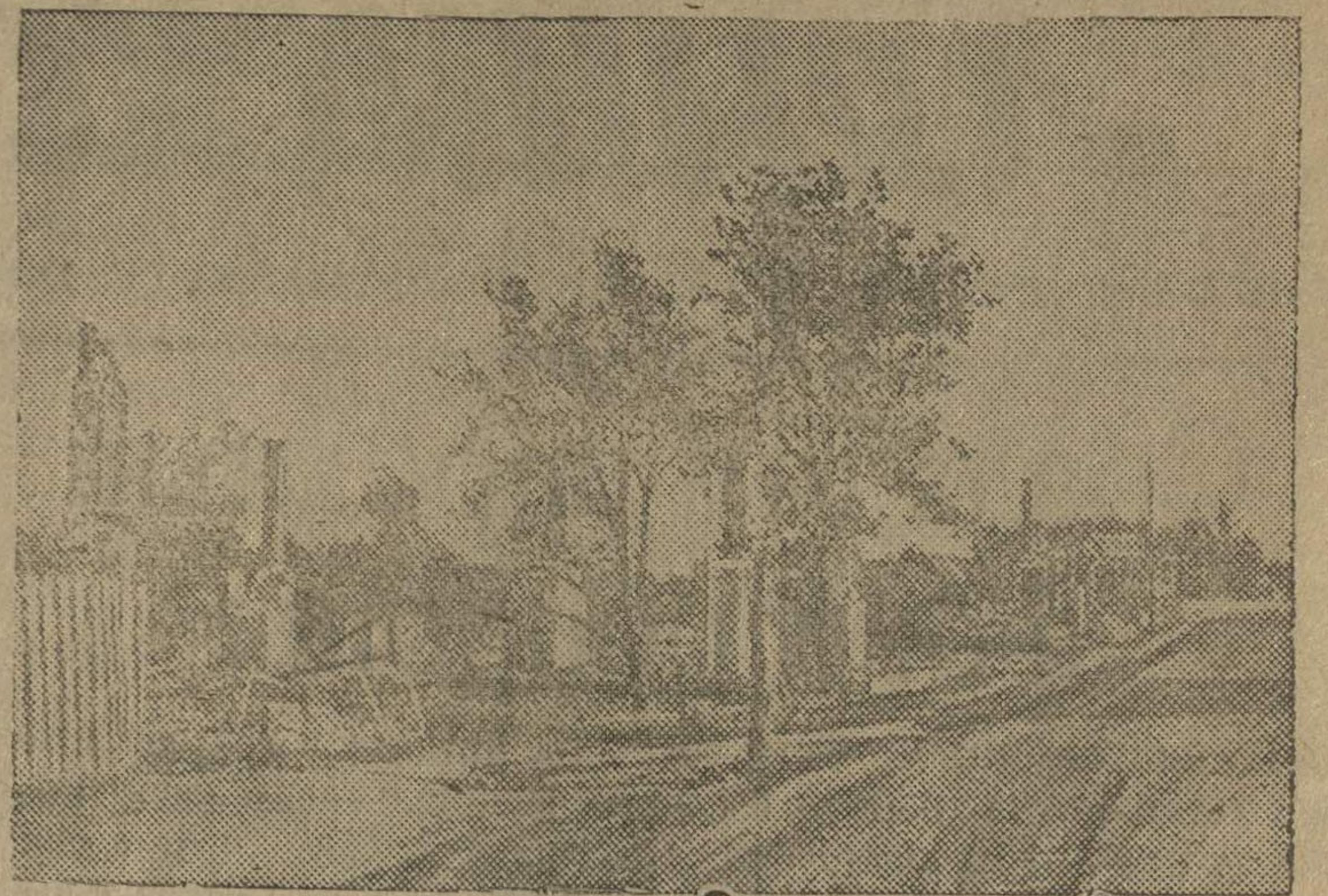
Вид одной из улиц поселка Западной Белоруссии после кратковременного хозяйничанья гитлеровских бандитов.

Партизанский отряд под командованием председателя сельского кооператива тов. Г. обнаружил в лесу немецкий склад горючего. Партизаны сообщили о местонахождении склада командиру эстонской авиачасти майору Хлынову. В тот же день советский бомбардировщик взорвал фашистское бензиохранилище.