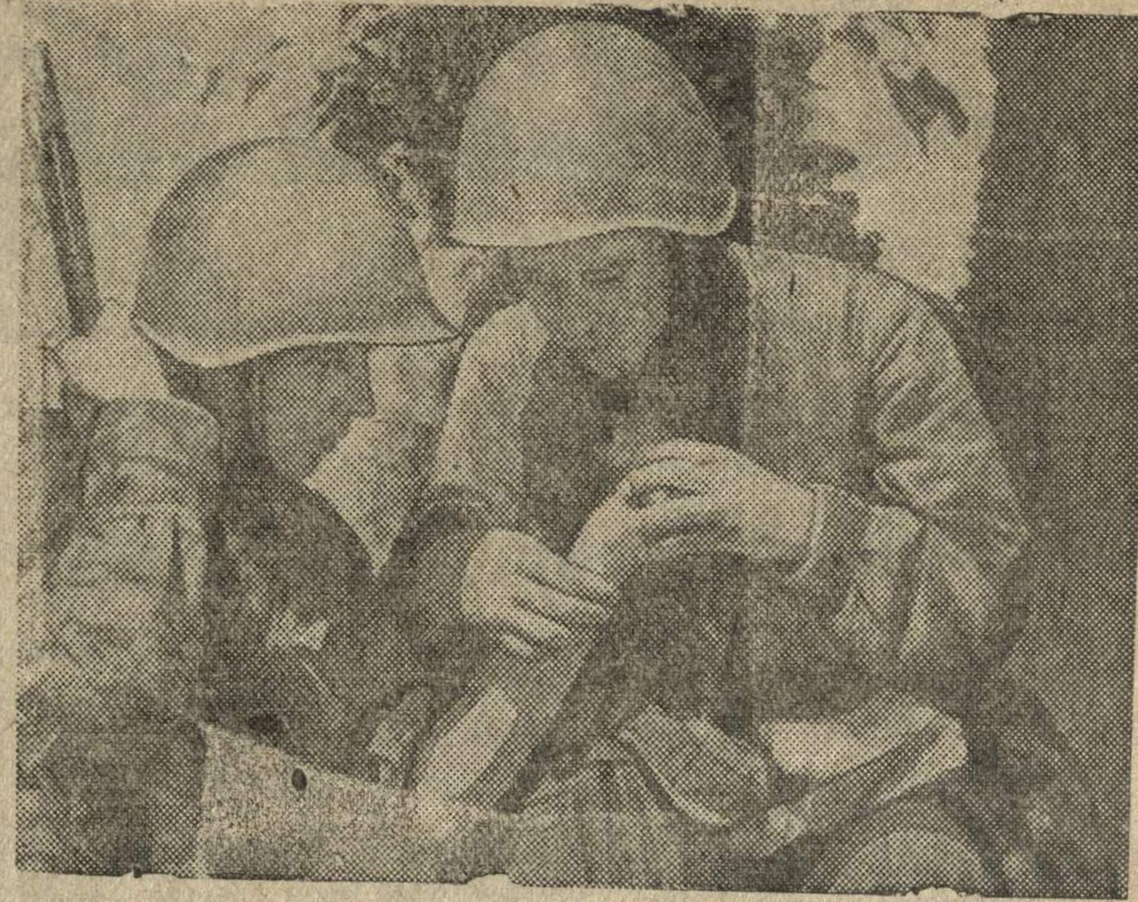
Оказание первой помощи раненому бойцу.