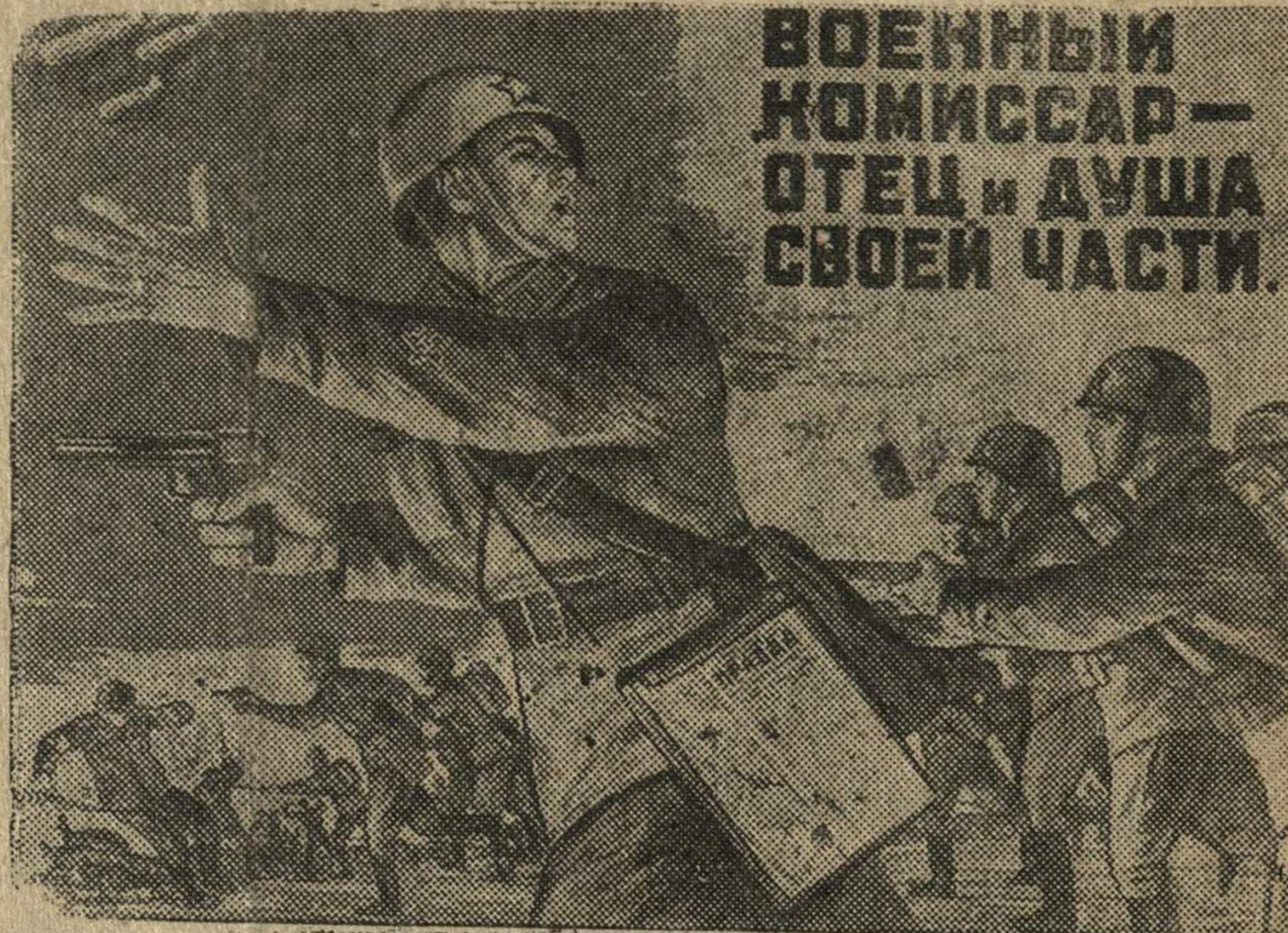
Рисунок художника Мальцева. (Репродукция с плаката, выпускаемого издательством «Искусство».)

и Полномочного Посла Польши в СССР г-на Кот.