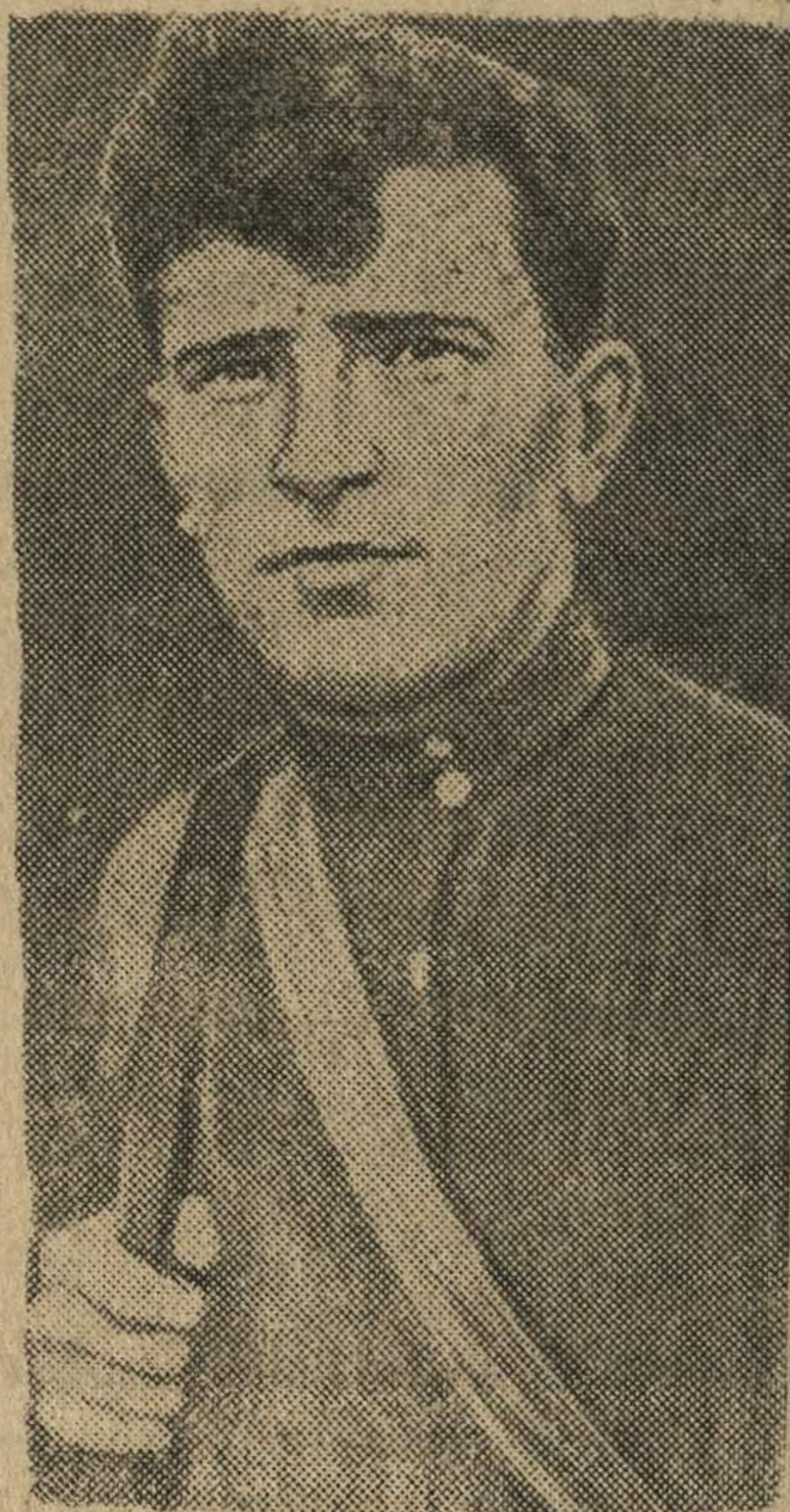
Сельская интеллигенция — активный участник партизанского движения. Учитель села Н., коммунист тов. П. первым в селе вступивший в партизанский отряд.

держав в Москве В. Гарриман и остальные члены делегации прибыли в Лондон.