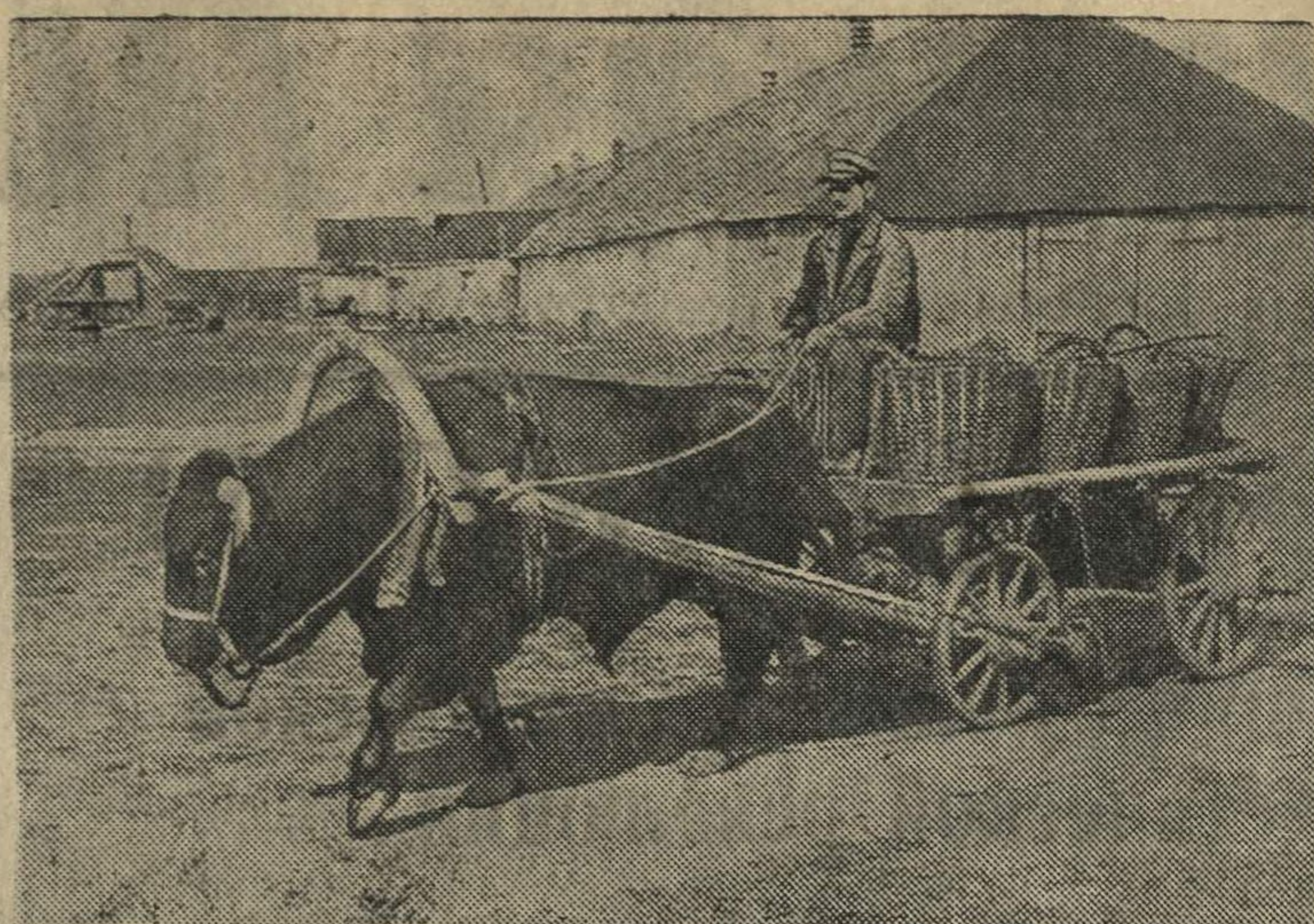
В Сокольском колхозе „За новый быт“ используют быков в качестве тягловой силы.

— Бесспорно дело полезное, нужное, мы не возражаем, — говорят директора, — но... «а воз и ныне там» И десятки тысяч рублей продолжают плавать по Богородску. С Хентова.