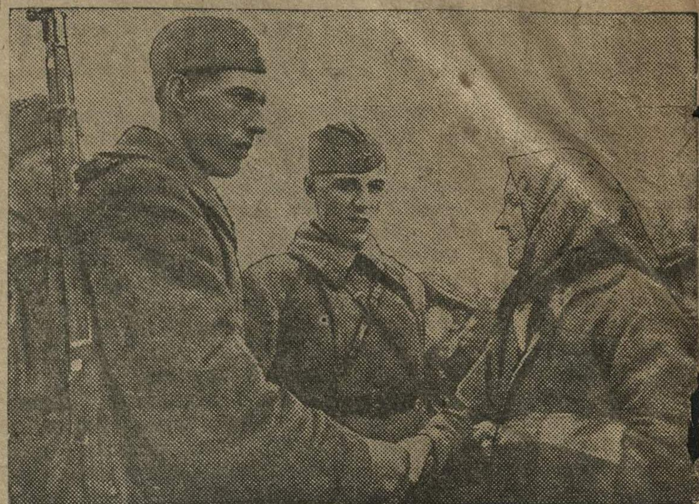
Встреча Красной Армии с населением Западной Белоруссии. На снимке старая крестьянка приветствует бойцов и командиров (м. Молодечно).

Население Западной Украины и Западной Белоруссии радостно встретило советских бойцов, видя в них своих избавителей от помещичьей-капиталистической рабства. Улицы сел и городов к восторженному приветствию встречали красными флагами, люди надевали свою лучшую праздничную одежду, шло народное ликование. Население повсюду оказывало частям Красной Армии помощь в уничтожении остат-