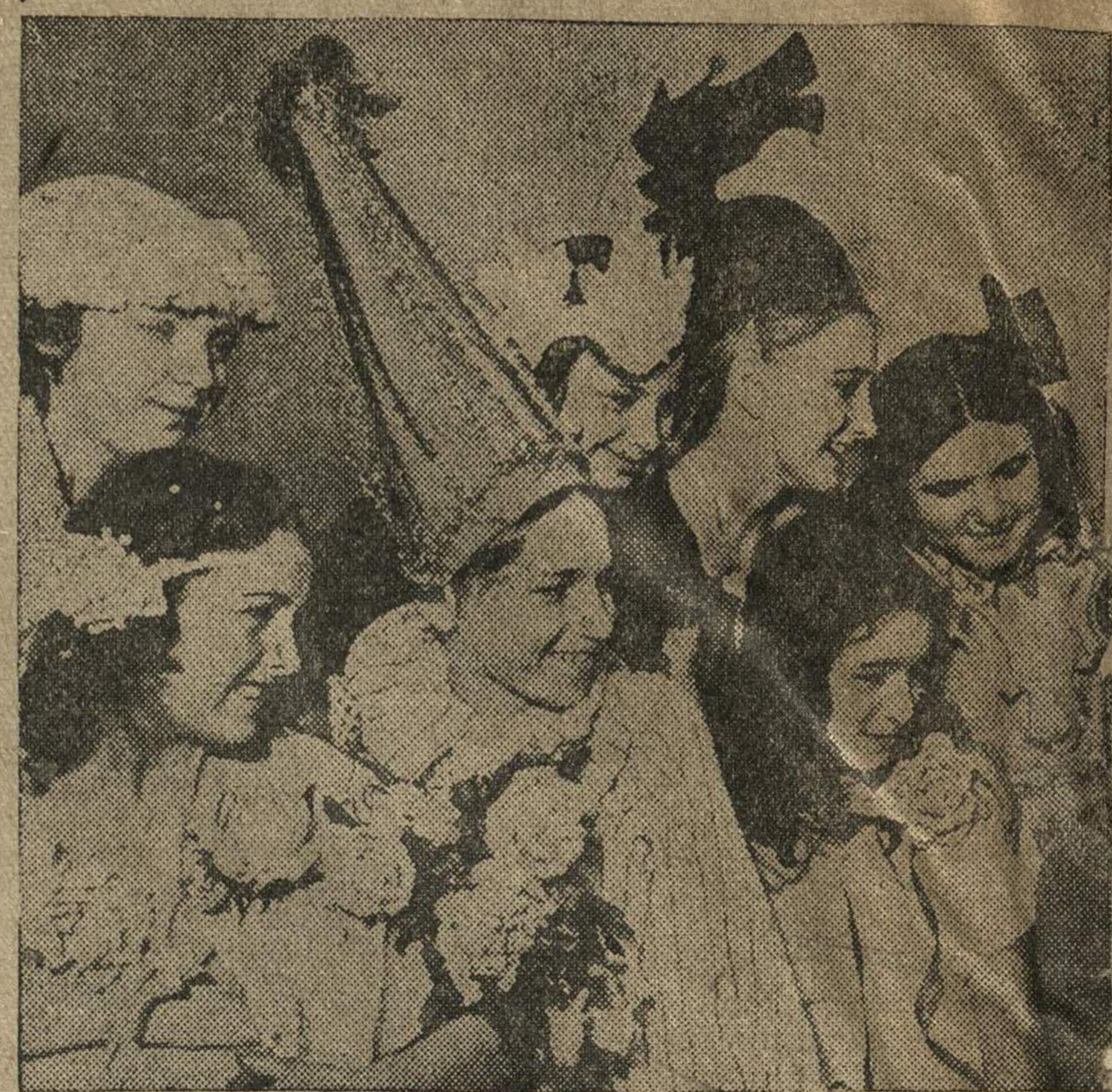
На новогоднем балу.