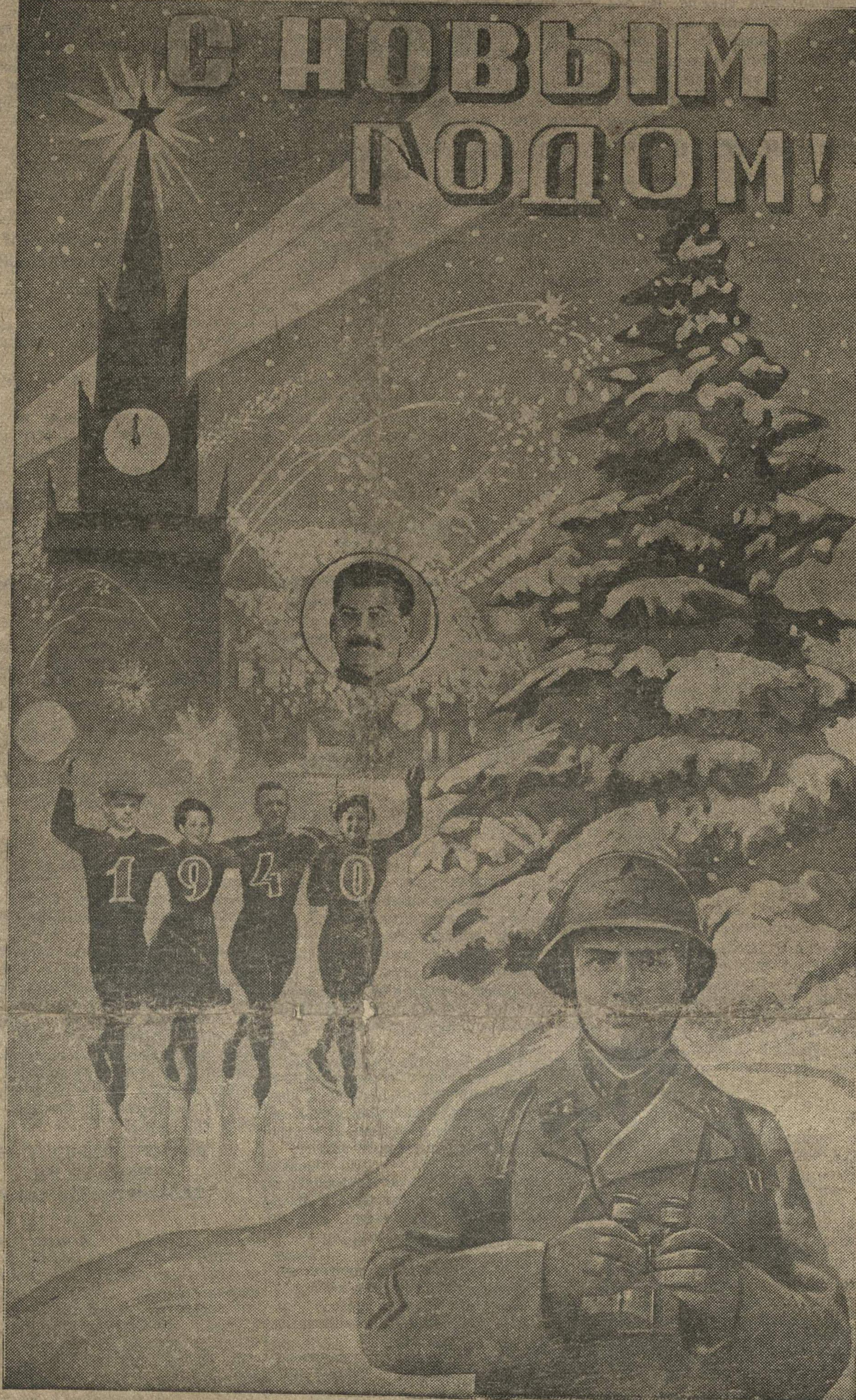
Монтаж Н. Головина.