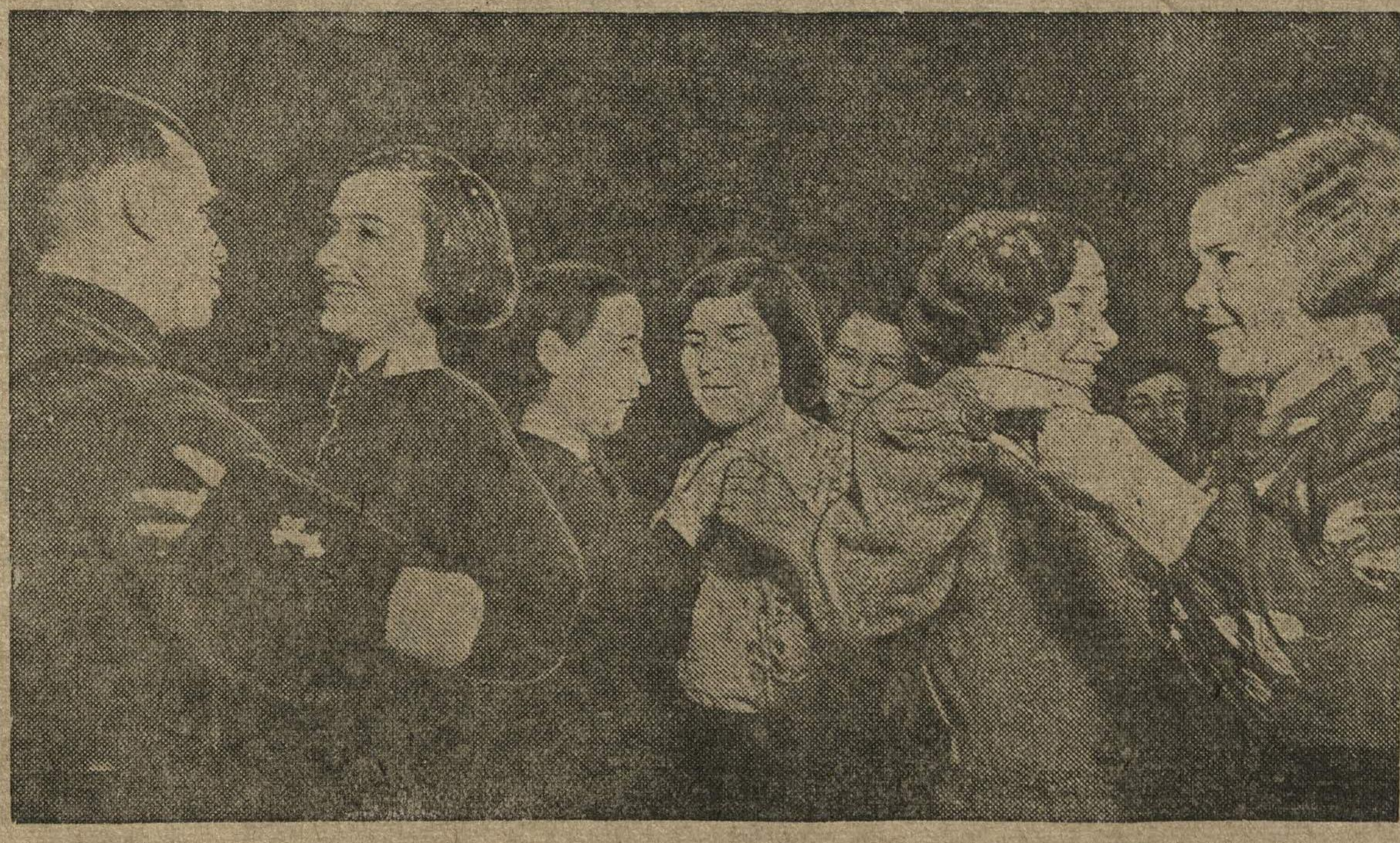
Весело и организованно встретил новый год коллектив рабочих и служащих завода имени Ленина в театре оперы и балета имени А. С. Пушкина. На снимке: танцы в фойе театра.

ЛОНДОН, 2 января. (ТАСС) Агентство Рейтер сообщает, что в время затопления города Лондонской (Дерри) в здании центральной пожарной части была брошена бомба. Взрывом уничтожена одна пожарная машина и навес. Человеческих жертв нет. Как полагают, бомба была брошена в качестве репрессивной меры за участие пожарных в подавлении волнений. Выпущенных в тюрьме Лондонской в время разгара стачки пожарных среди арестованных членов «ирландской республиканской армии».