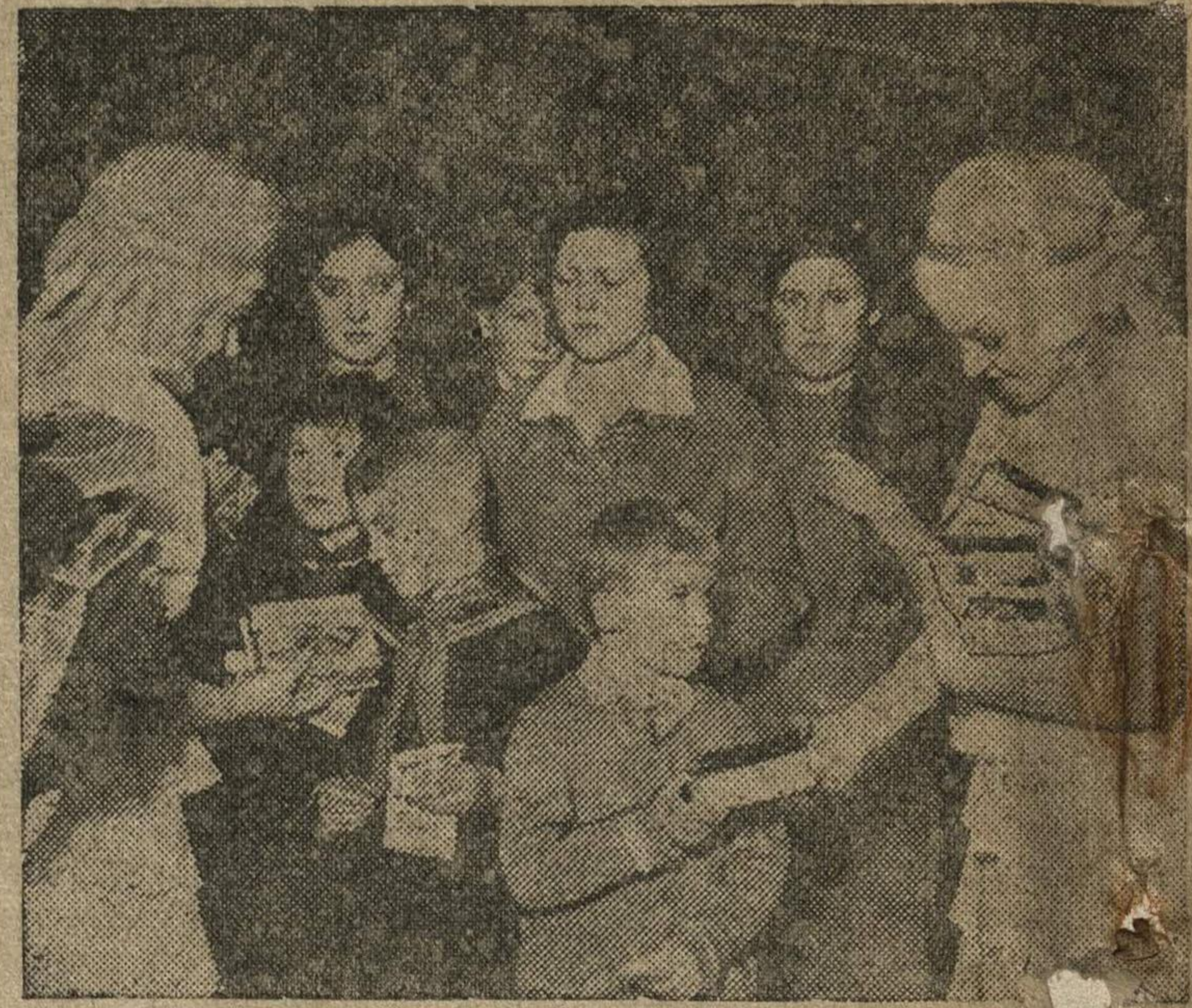
На общегородской елке школьников во Дворце культуры имени Ленина. На снимке: раздача подарков детям.