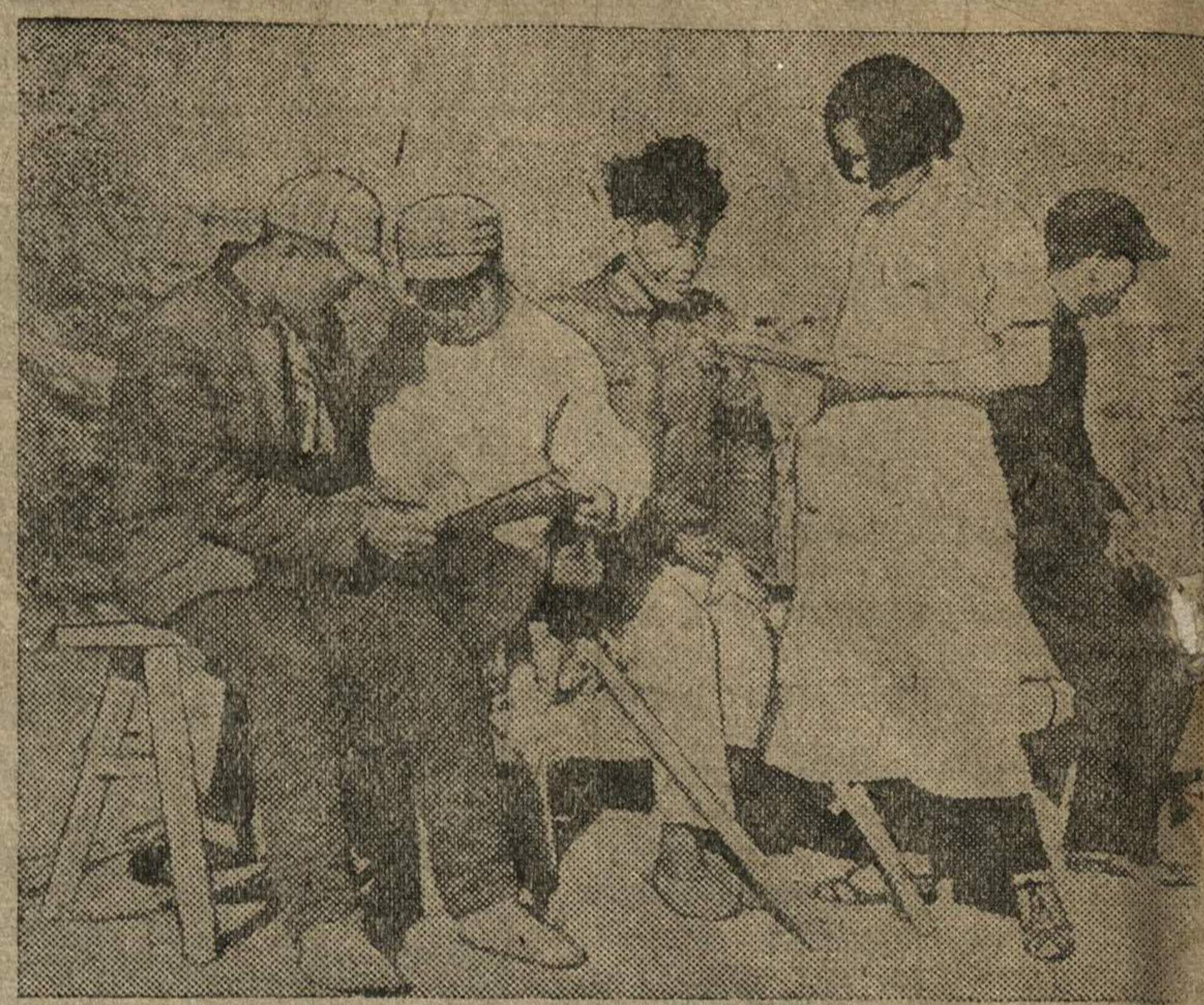
Китайские женщины принимают активное участие в борьбе своего народа против японцев. На снимке: медицинские сестры среди раненых бойцов китайской армии.

Металлисты Осло требуют от правительства принятия решительных мер против агентов поджигателей войны, пытающихся втянуть страну в ненужную войну. Профсоюз решительно осуждает любые попытки белогвардейцами со стороны оказания помощи белофиннам».