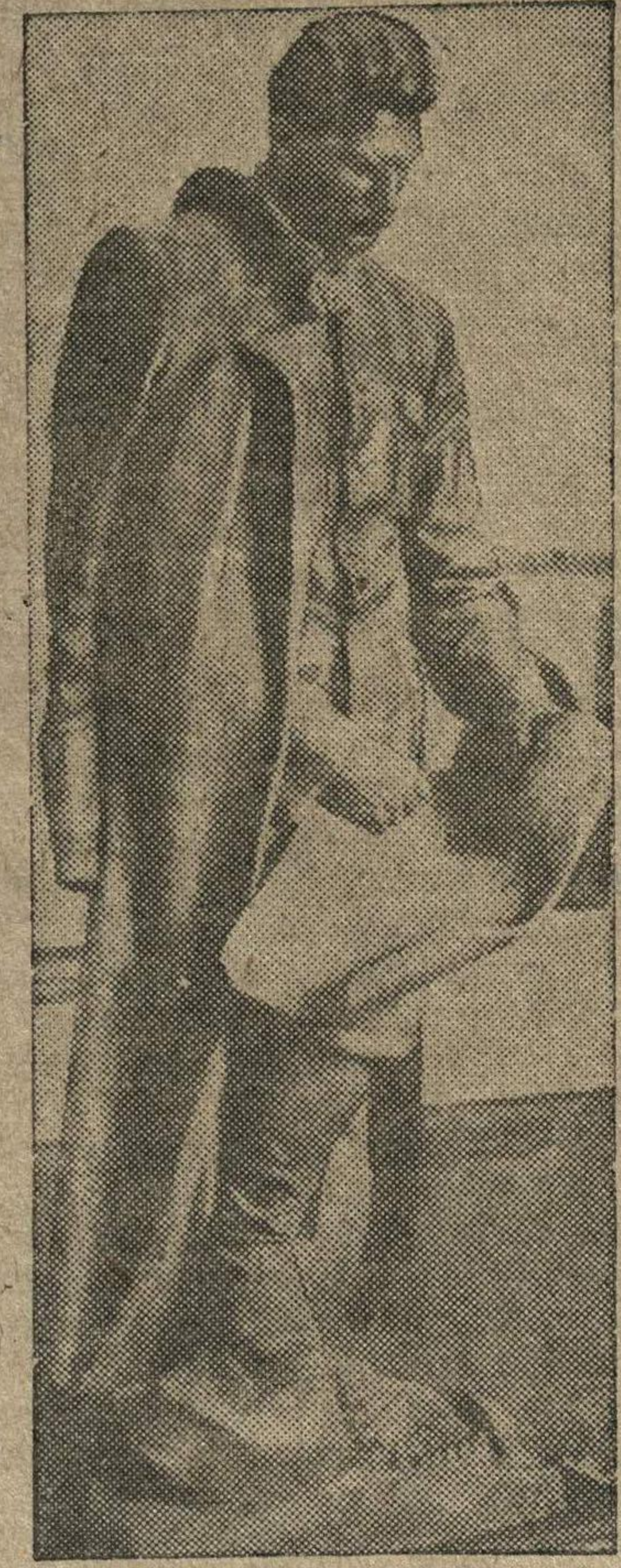
В Государственной Третьяковской галерее открыта выставка «Сталин в изобразительном искусстве». На снимке: скульптура «Сталин—стратег», работа скульптора Петрашевича.

После принятия обращения ко всем медицинским работникам области было оглашено постановление президиума облисполкома о внесении в областную книгу почетных 39 медицинских работников и о присуждении переходящего красного знамени облисполкома Автозаводскому району.