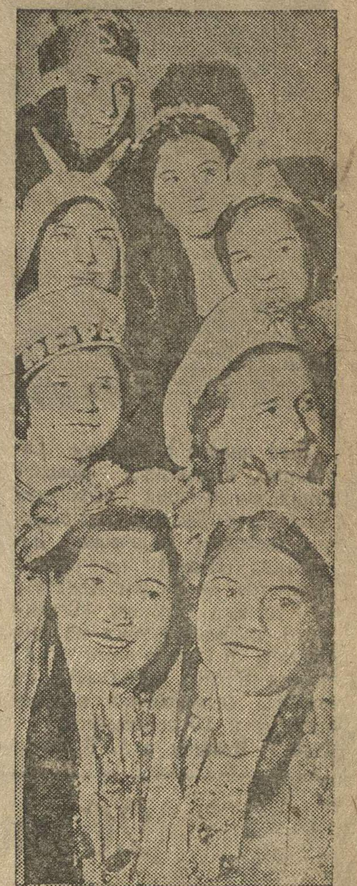
Группа школьников на балу во Дворце пионеров имени В. П. Чкалова.

И. ПЕЧЕРНИКОВА — научный сотрудник Горьковского областного института усовершенствования учителей.