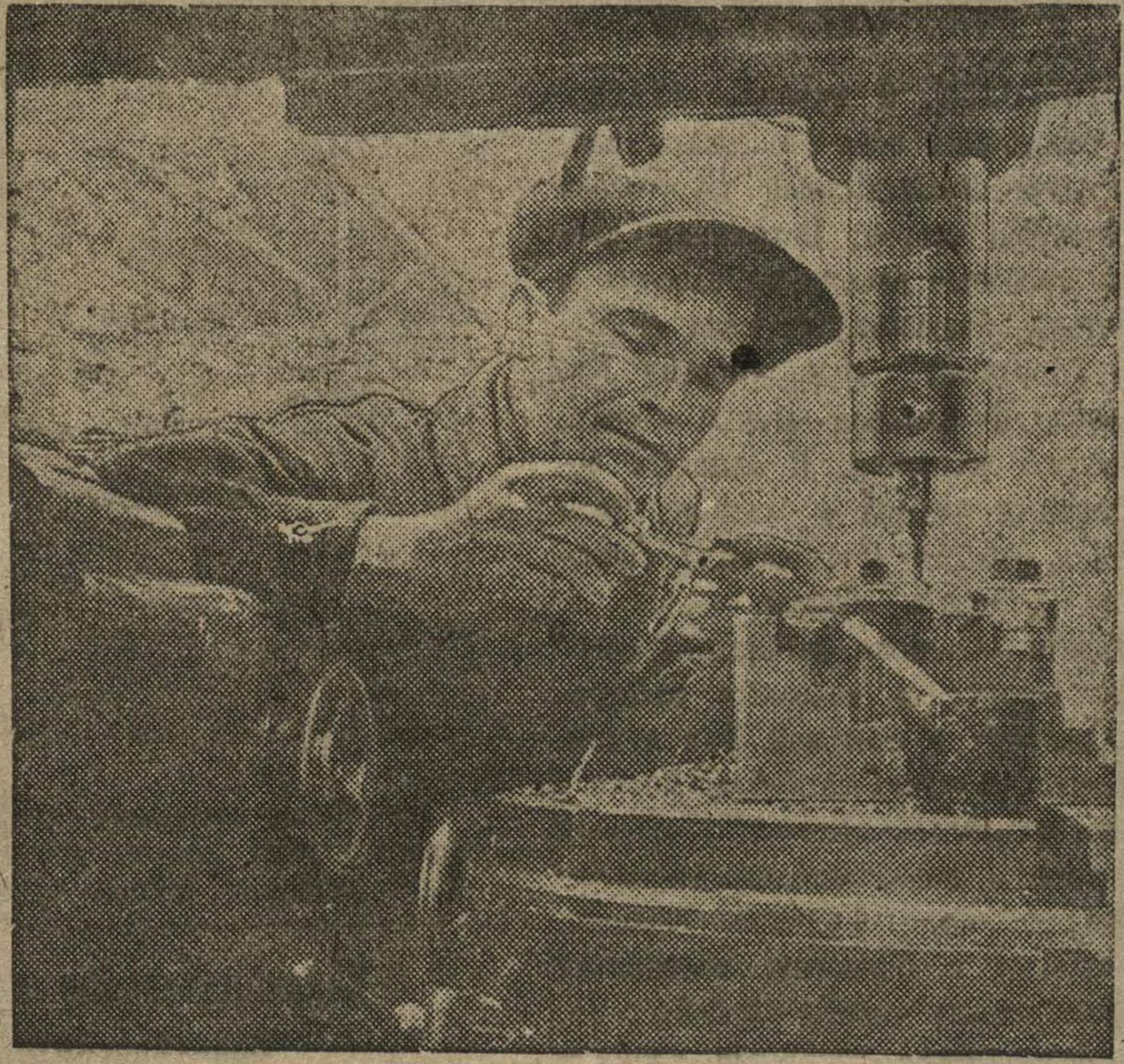
Тонарь-расточник автозавода им. Молотова, комсомолец Бобров систематически выполняет задание на 200 проц., давая отличное качество продукции.