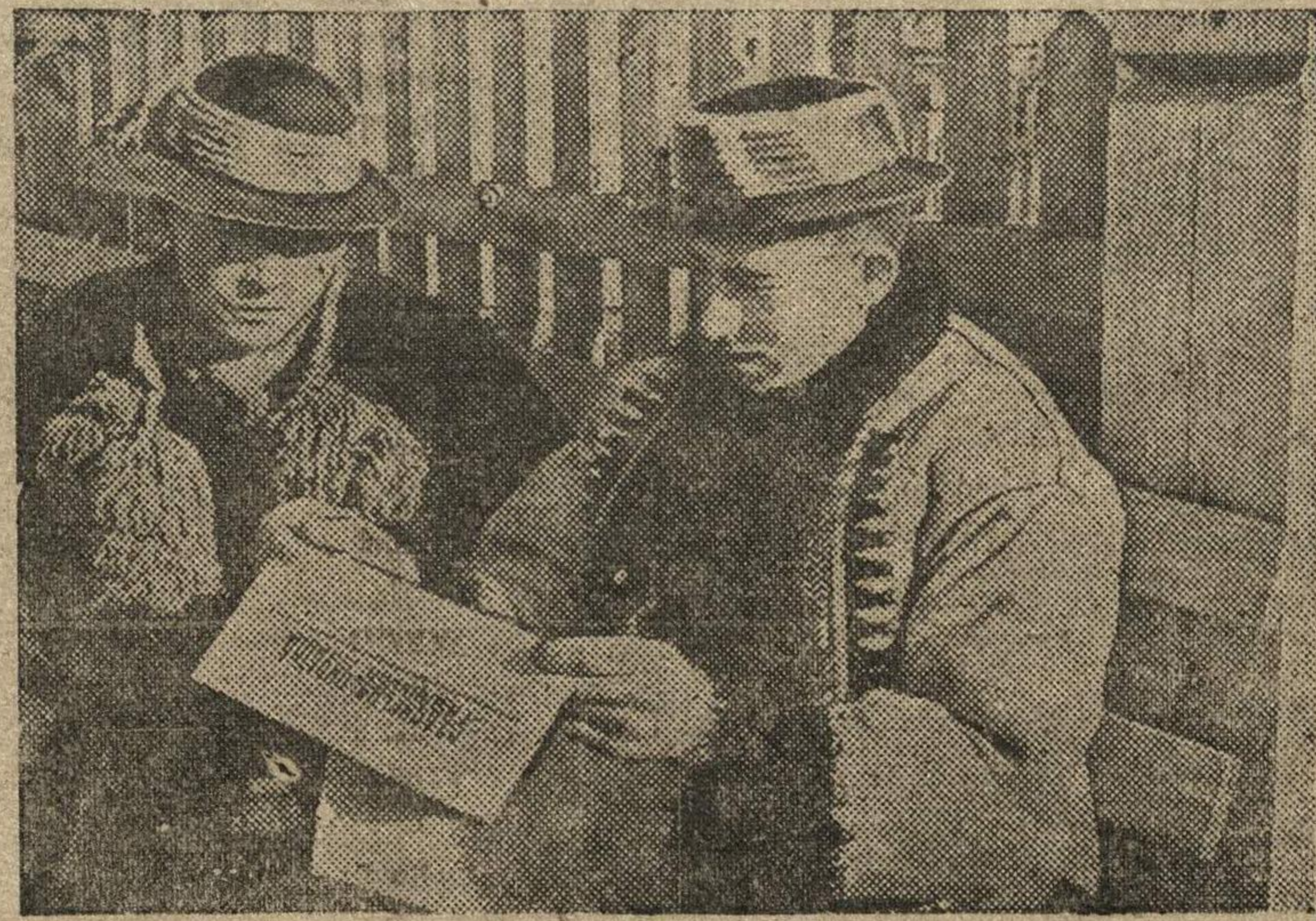
На снимке: крестьяне села Жабо (Гуцульский национальный район, Западная Украина) читают газету.

Всесоюзному комитету поручено в десятидневный срок разработать и внести на утверждение Правительства СССР план мероприятий по увековечению памяти В. В. Маяковского и популяризации его творчества среди народов СССР. (ТАСС).