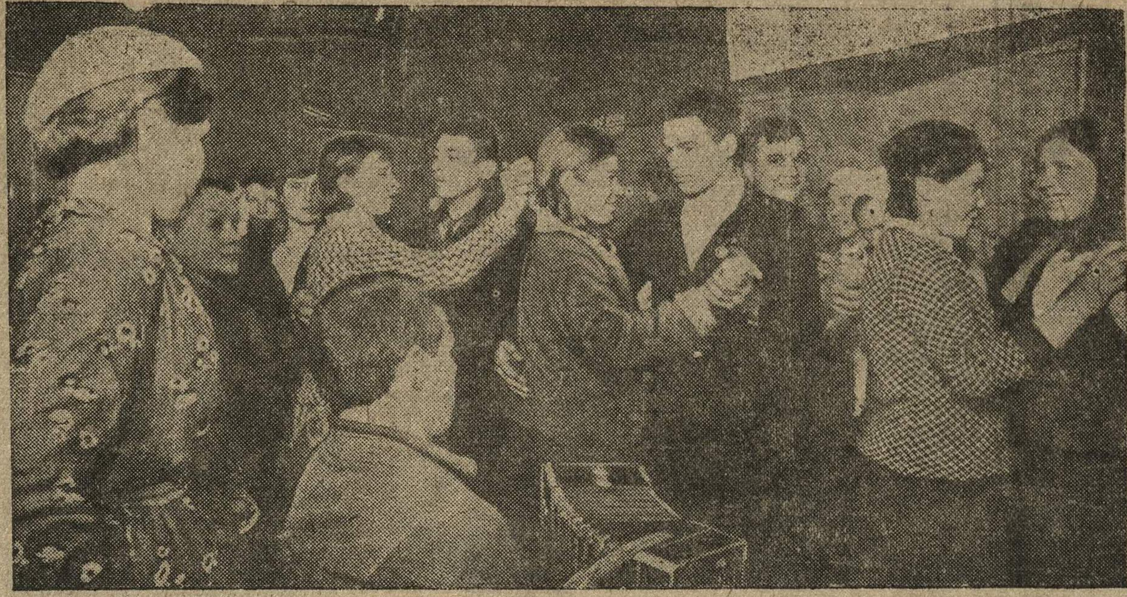
Весело проводят время в своем клубе молодежь колхоза «Исира» Пильненского района. На снимке: танцы в клубе.