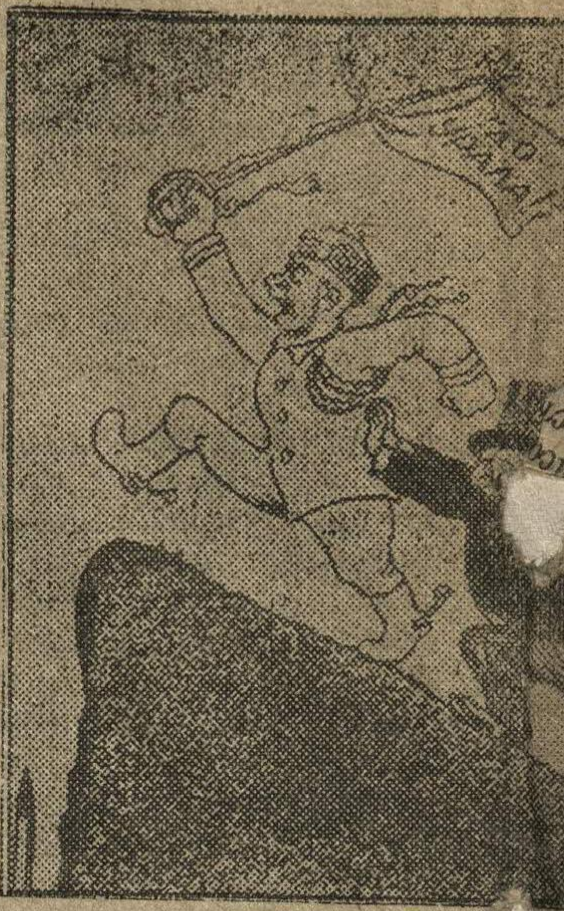
Рис. Отарова. (ТАСС).