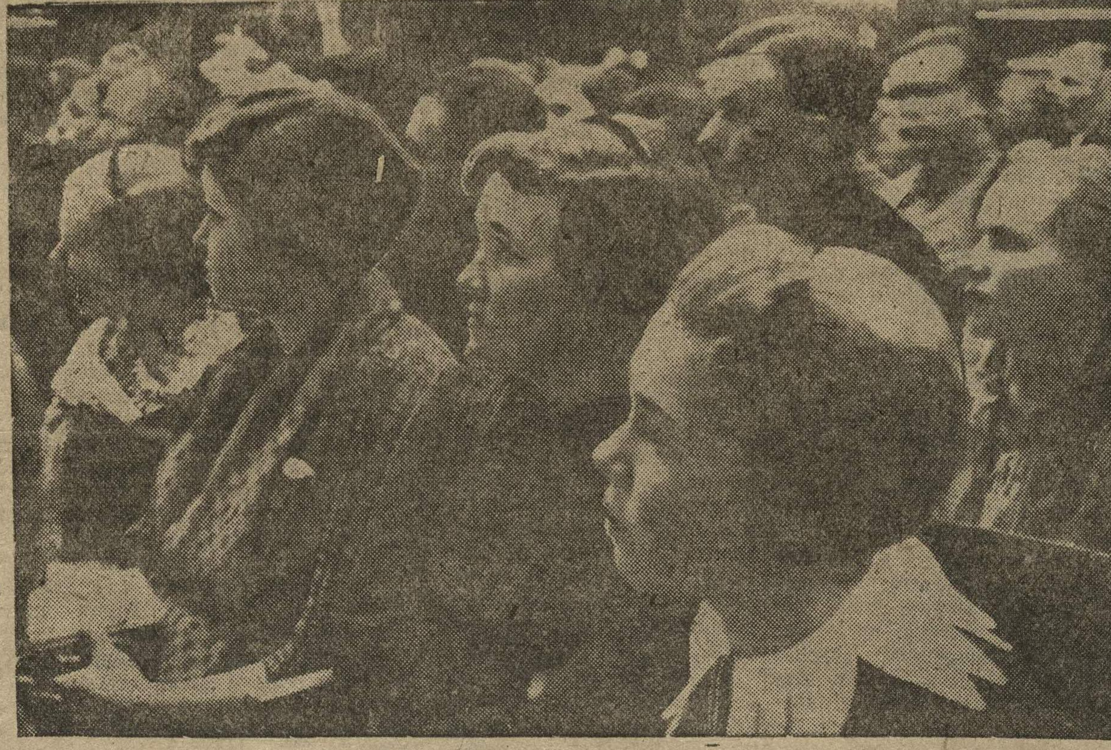
На заседании областного комсомольского актива.