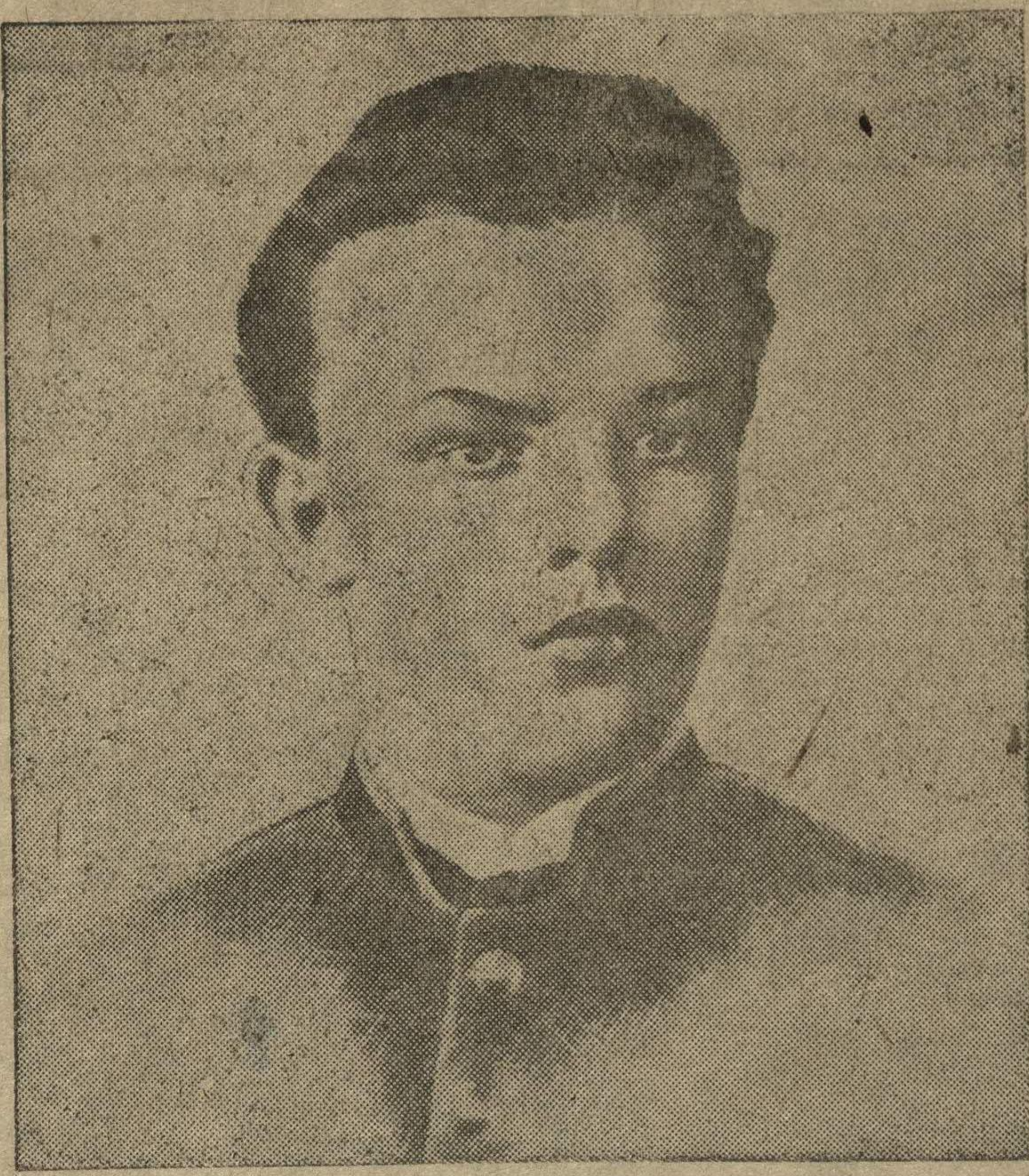
В. И. Ленин — гимназист. Портрет работы художника Е. Кацмана.