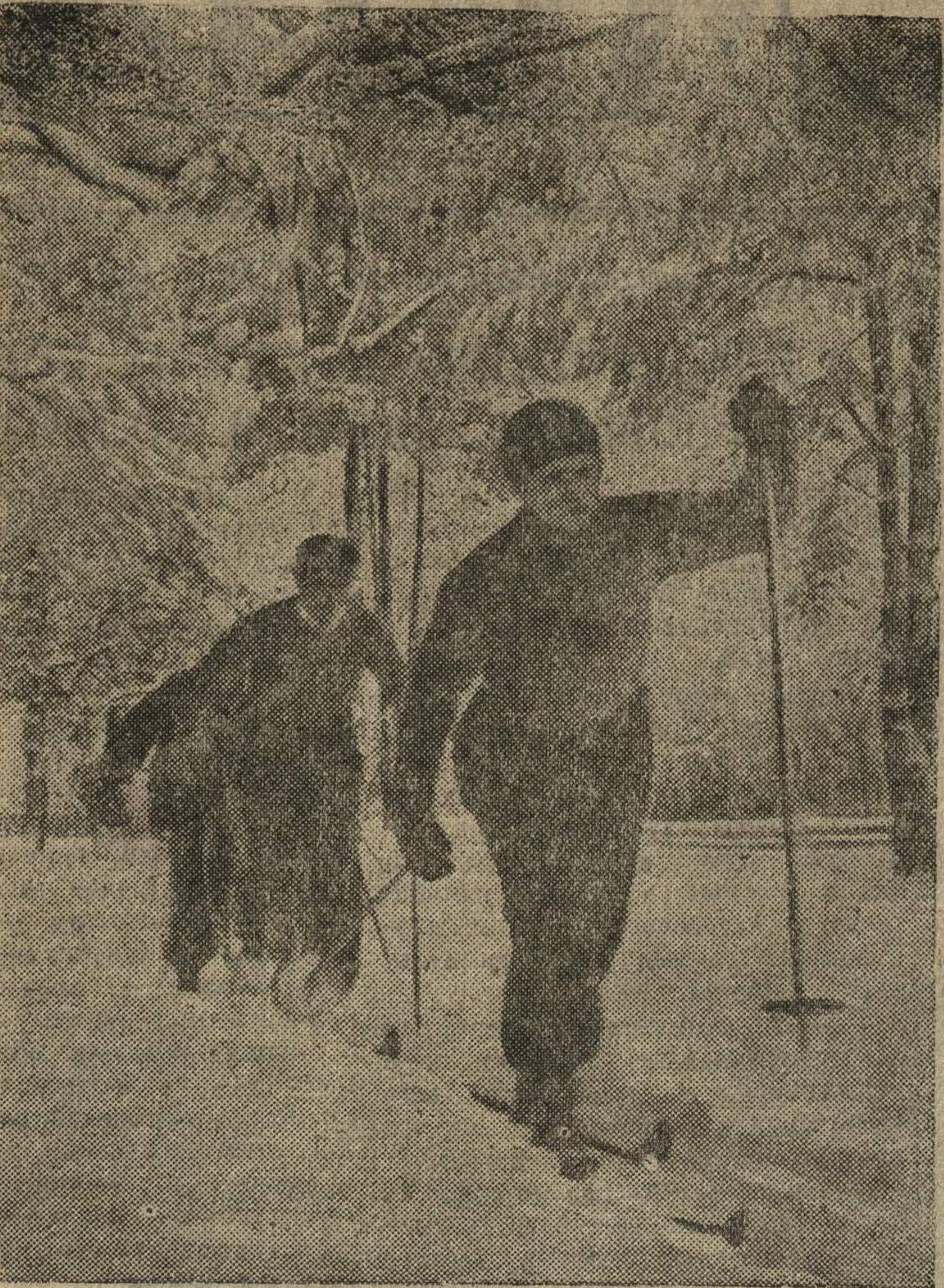
На лыжной прогулке.