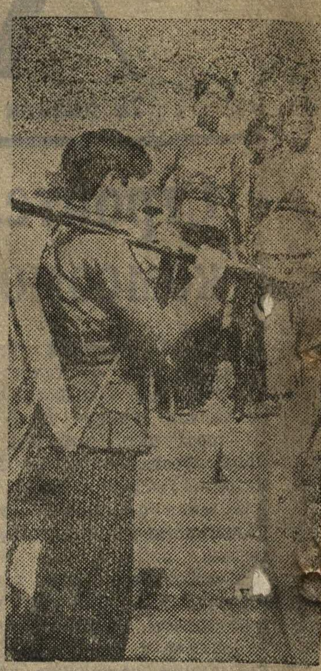
Китай. Участницы женского партизанского отряда.