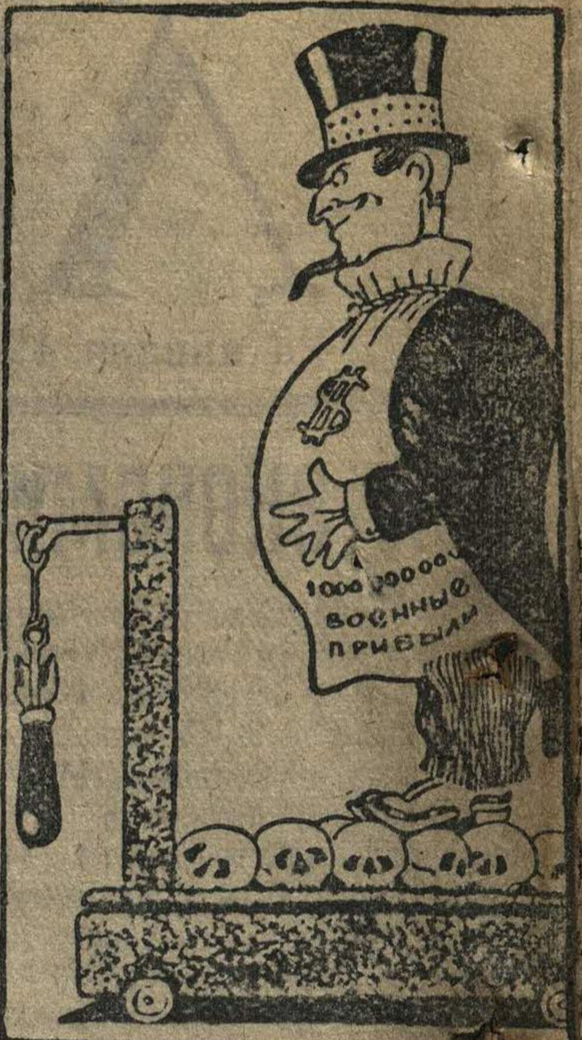
АМЕРИКАНСКИЙ ТОРГОВЕЦ ОРУЖИЕМ: Ого! За время войны в Европе я уже успел пополнить. Рис. Отарова.

ТОКИО, 22 января. (ТАСС). Агентство Домей Цусия сообщает, что вчера, в 12 часов 30 минут японский пароход «Асама Мару»,шедший из США в Йокотаму, был остановлен английским крейсером в территориальных японских водах, в 35 с половиной милях от японского побережья. Морские английские крейсера, находясь на борту «Асама Мару», произвели на нем обыск. На судне находилось 51 немец, 21 из которых был уведен англичанами на крейсер.