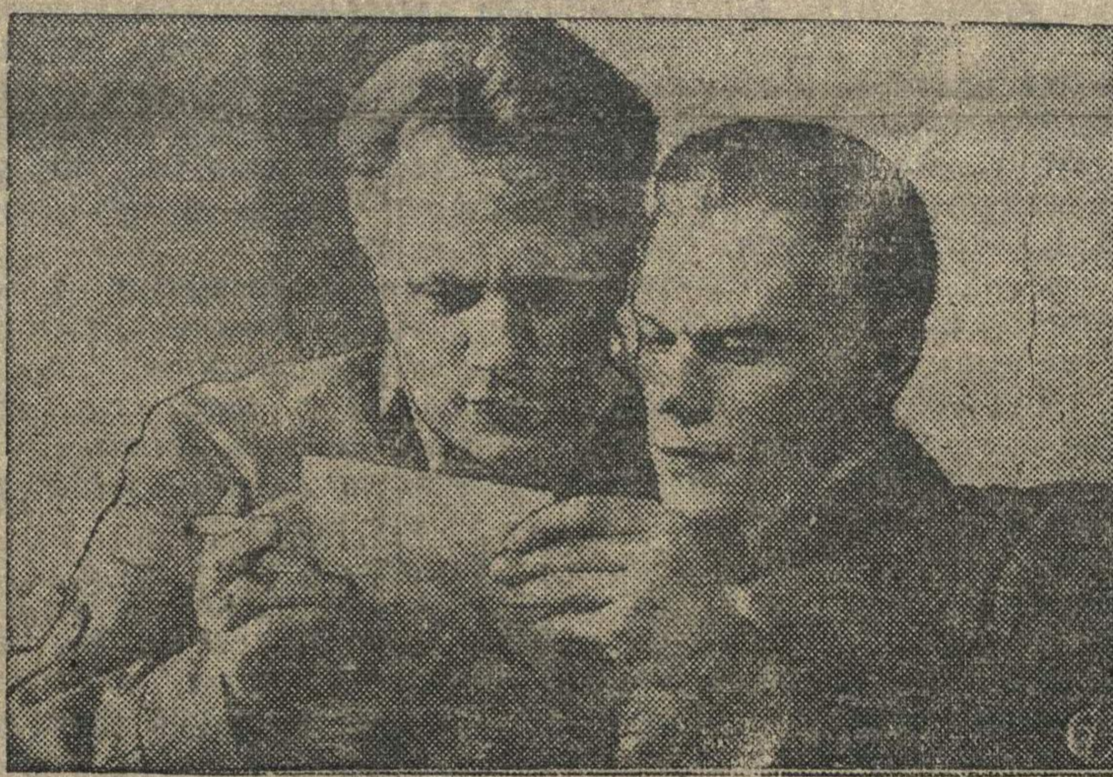
Кадр из фильма «Ошибка инженера Кочина».