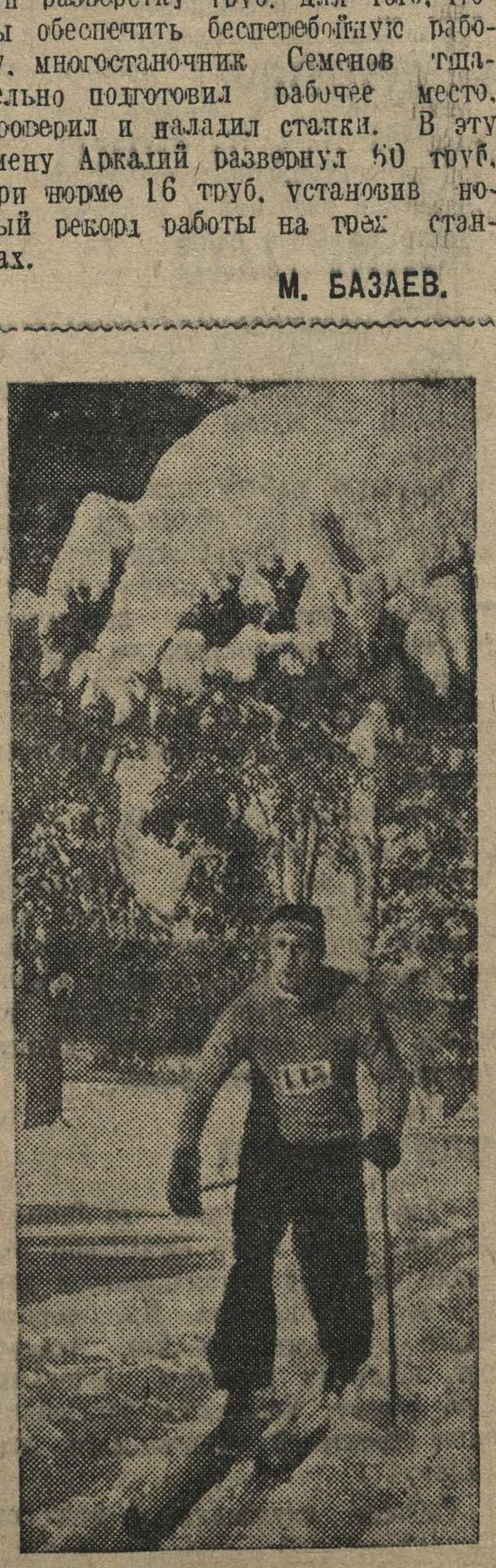
На лыжах за гоноком.