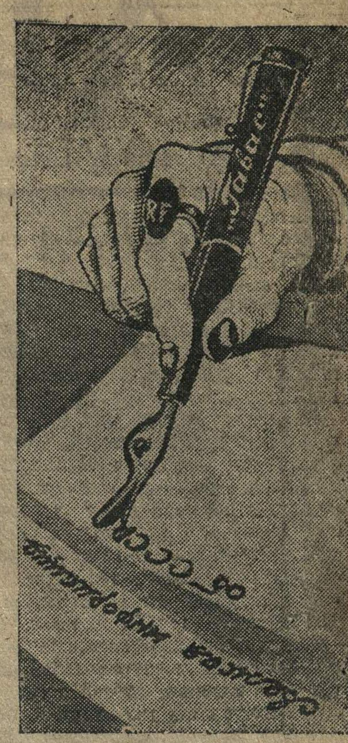
«Вечная ручка» агентства Гавак. Рисунок Милкстова.

ЛОНДОН, 26 января. (ТАСС). Агентство Рейтер передает по радио сообщение своего шанхайского корреспондента о том, что 24 января близ Фуцзю (провинция Фуцзянь) японская канонерка произвела два выстрела по английскому пароходу «Уинг Санг», который становился на якорь. После этого японские моряки поднялись на борт парохода и заявили капитану, что выстрелы произведены в ответ на задержание англичанами японского парохода «Асама-Мару».