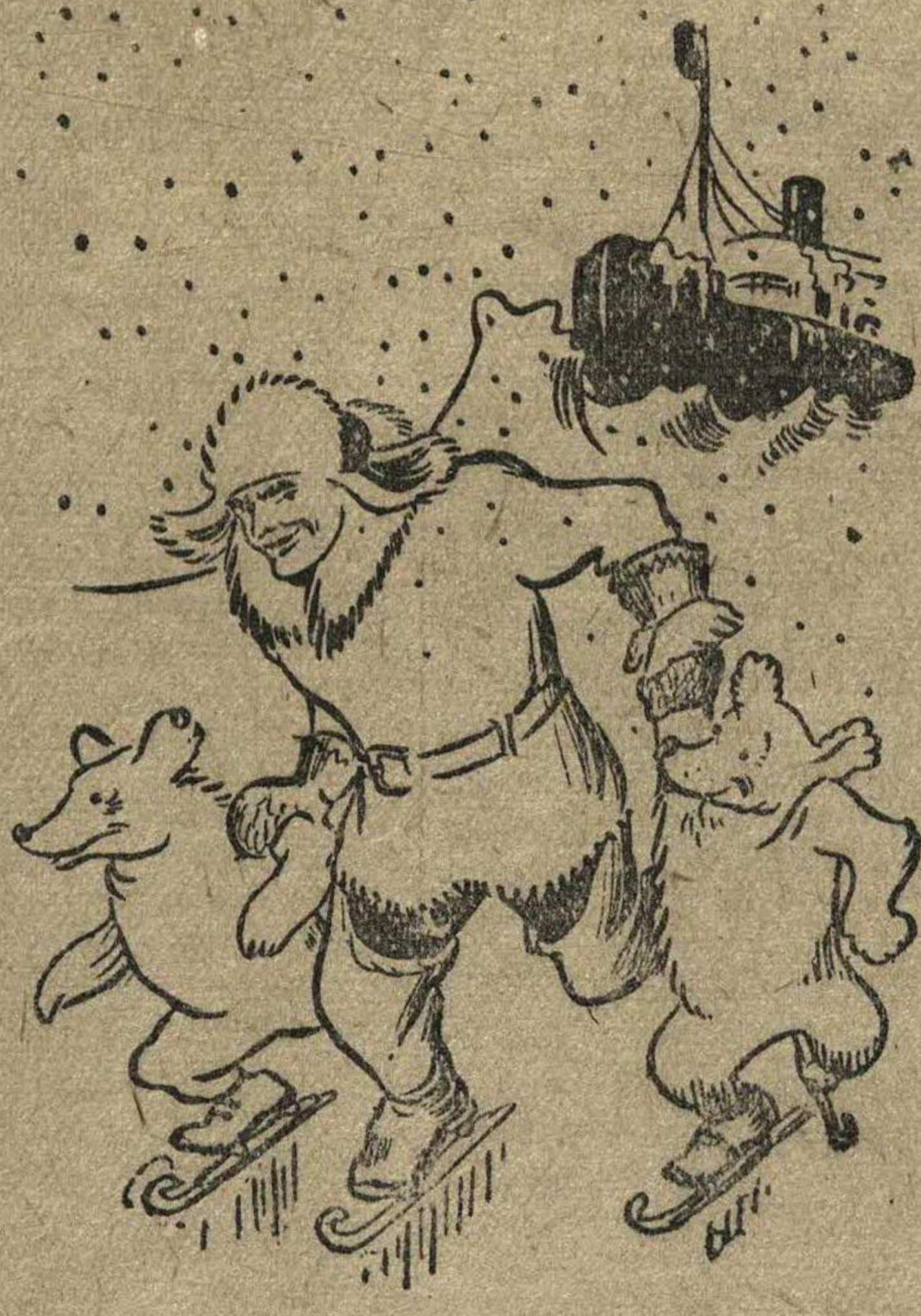
«2 апреля 1939 г. Вчера начали новую вахту, Станцию закончили сегодня в 13 часов. НЕМНОГО ОТДОХНУВ, ПОШЛИ КАТАТЬСЯ НА КОНЬКАХ».