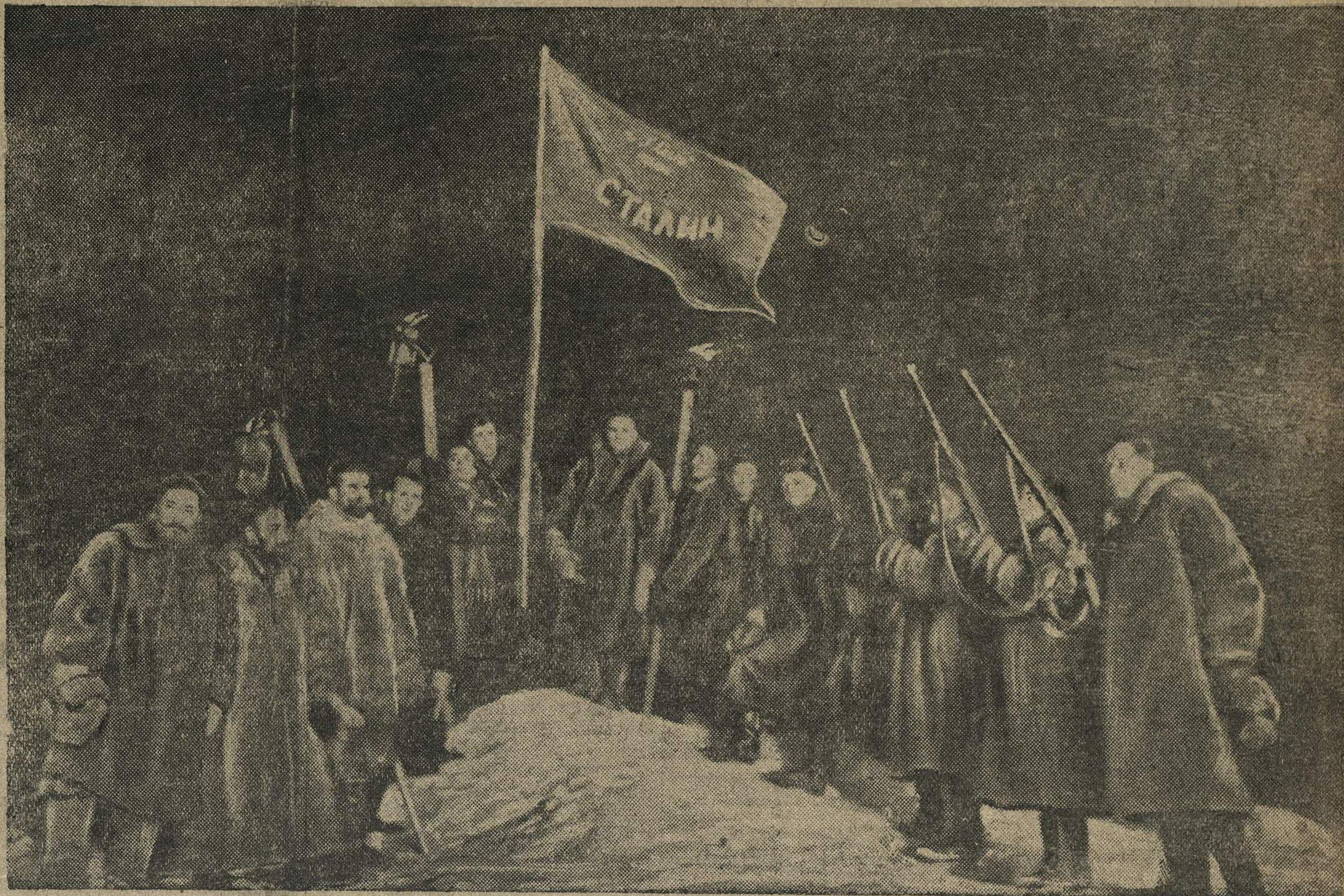
По окончании исторического дрейфа седовцы водружают на льдине флаг с именем Сталина.