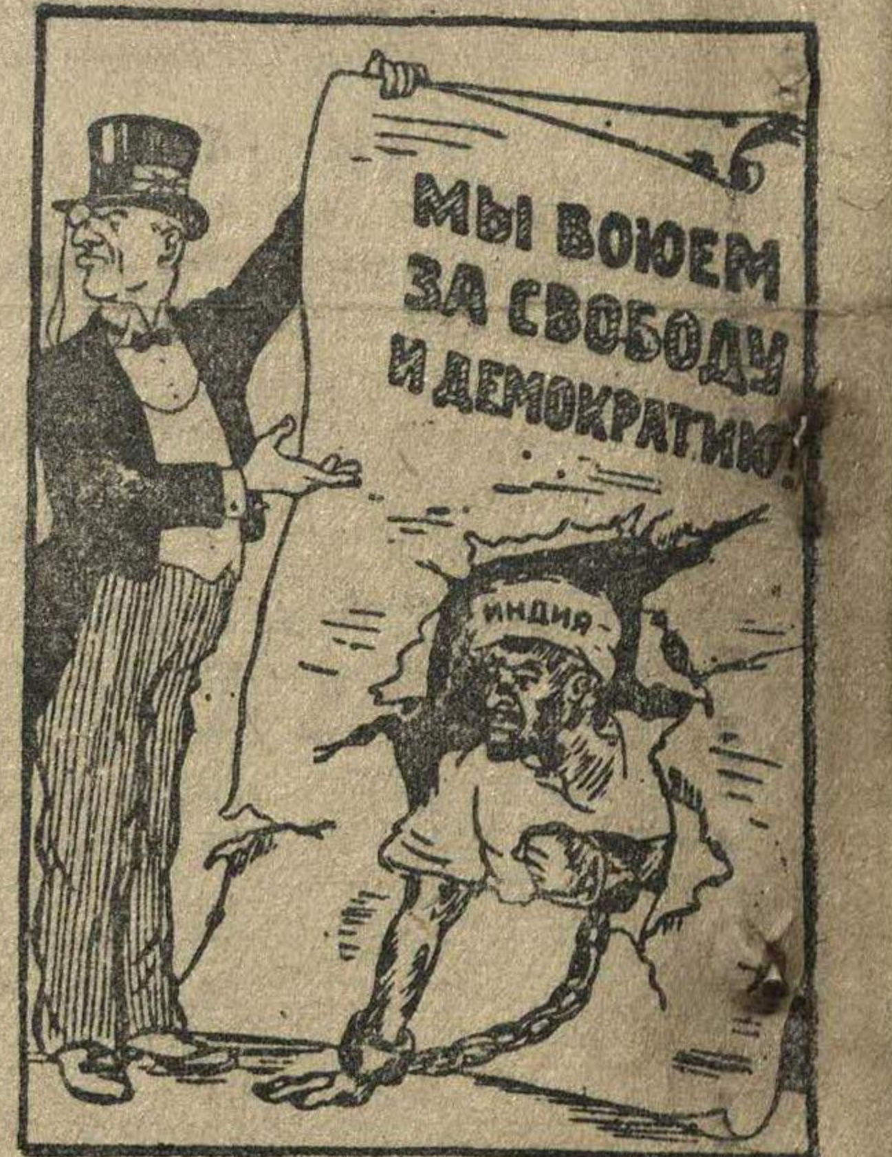
Рис. Лисевича.