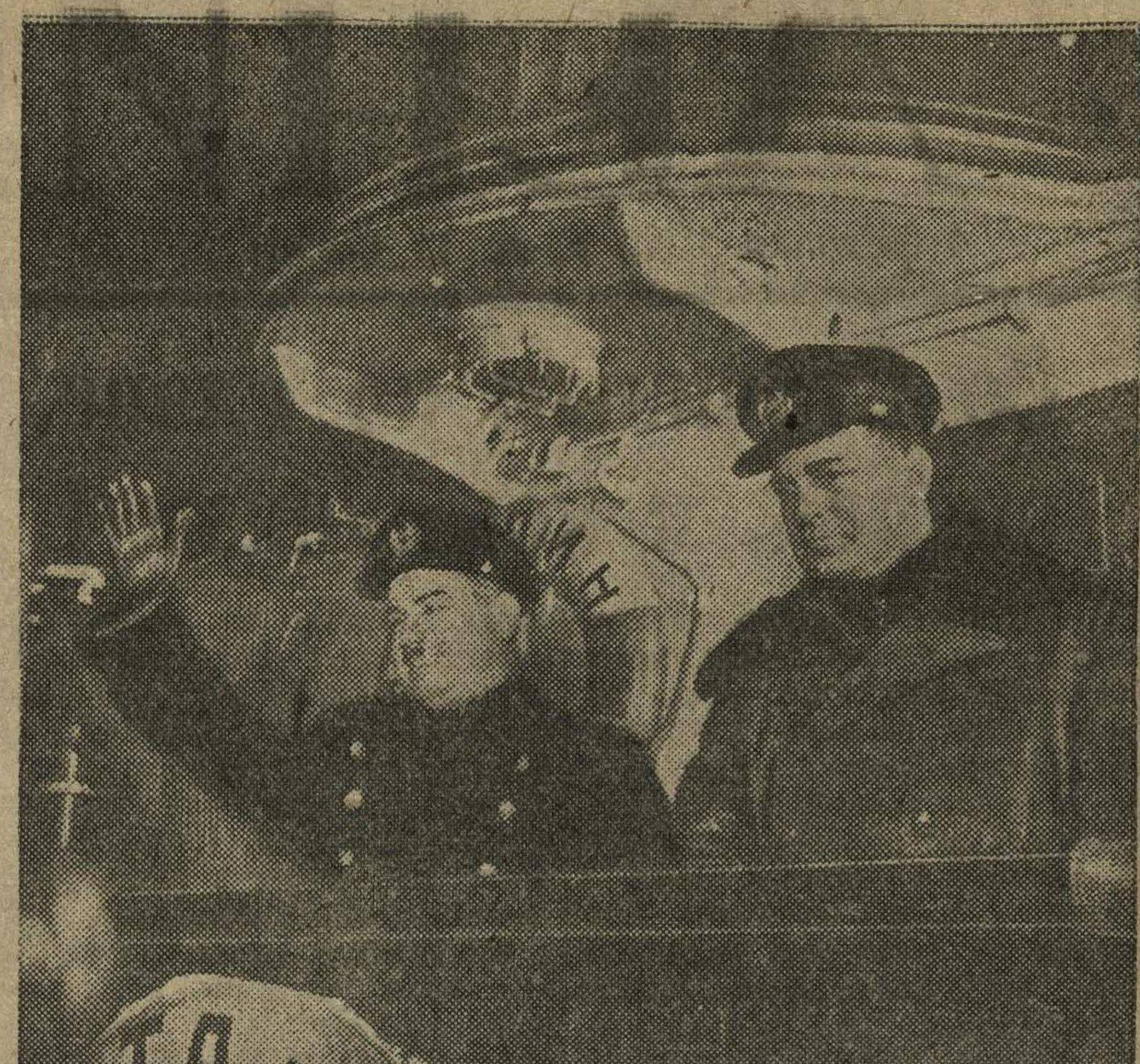
Начальник экспедиции Герой Советского Союза И. Д. Панагин и капитан ледокола «И. Сталин» М. П. Белоусов на капитанском мостике перед выходом в море.