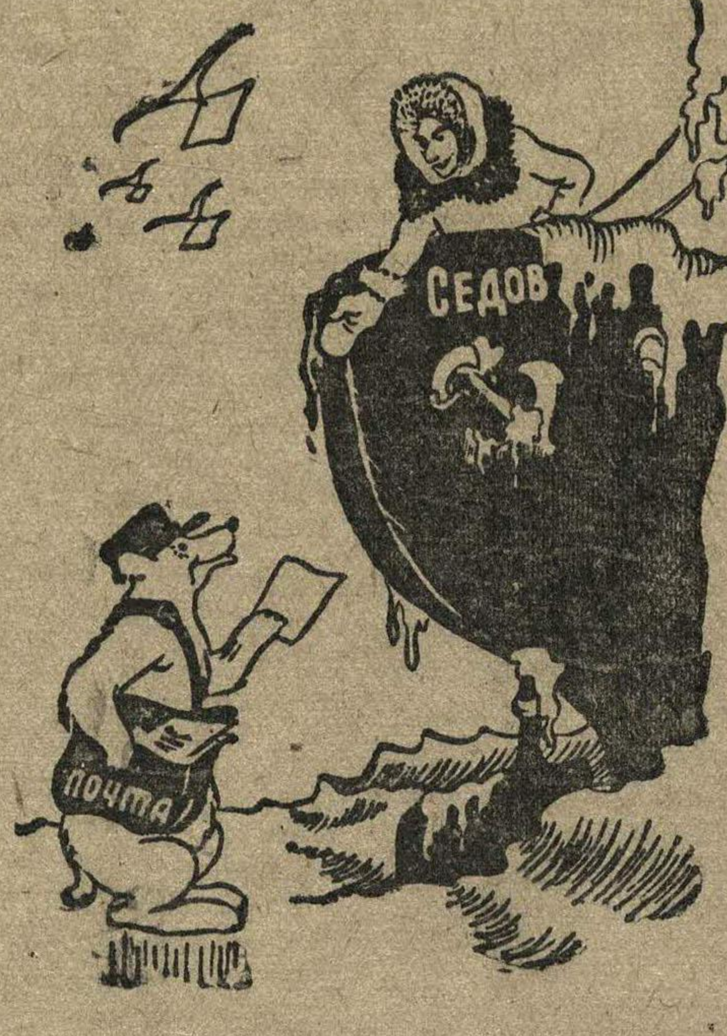
«1 мая 1939 г. Погода совсем не-президничная, небо затнуто облаками. Зато очень тепло. ПОЛУЧИЛИ МНОГО ПРИВЕТСТВЕННЫХ ТЕЛЕГРАММ».

Дружеские иллюстрации Н. Головина в дневнику седовца В. Х. Буйницкого.