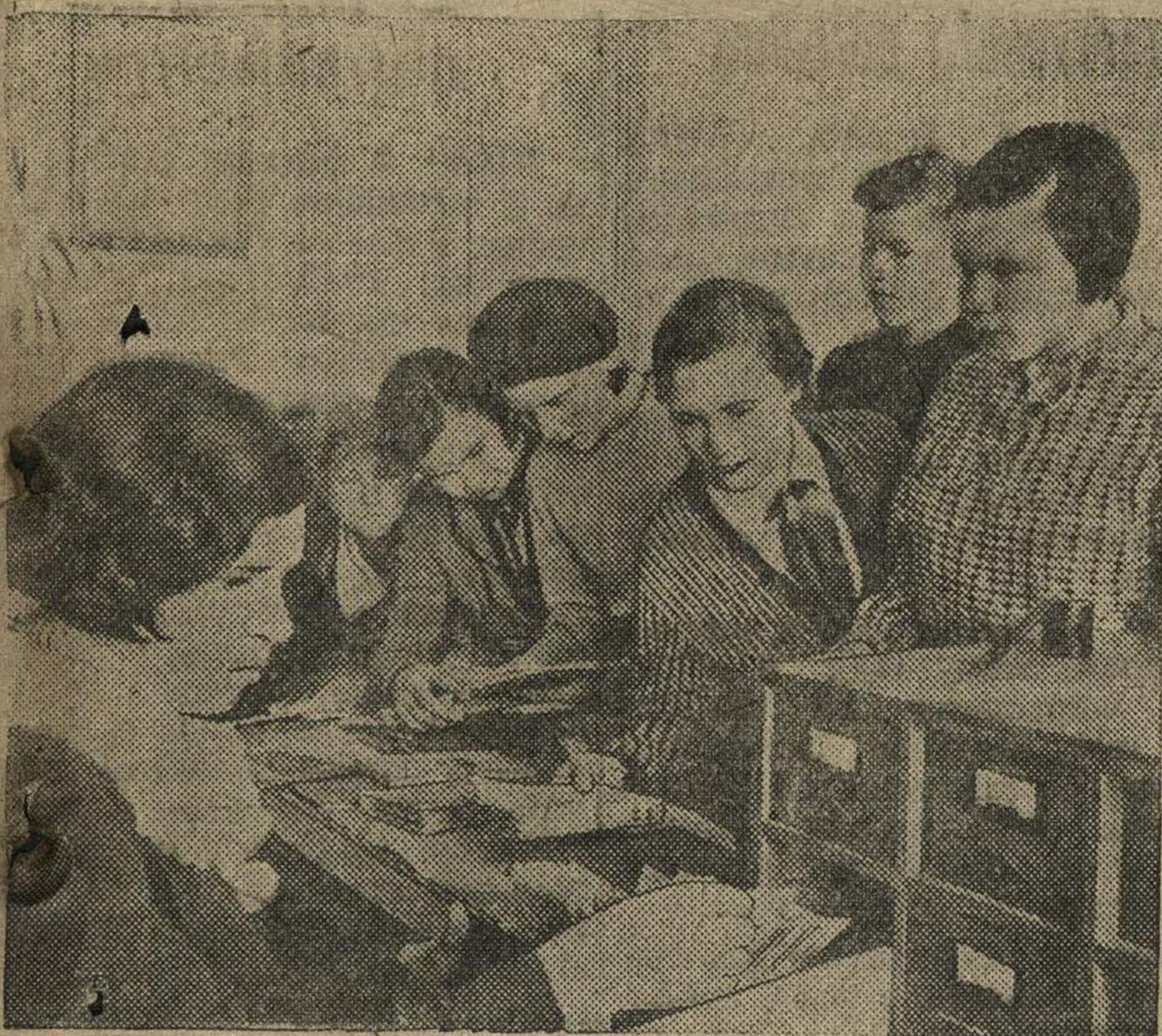
Выдача книг в школьной библиотеке школы № 19 Автозаводского района г. Горького.