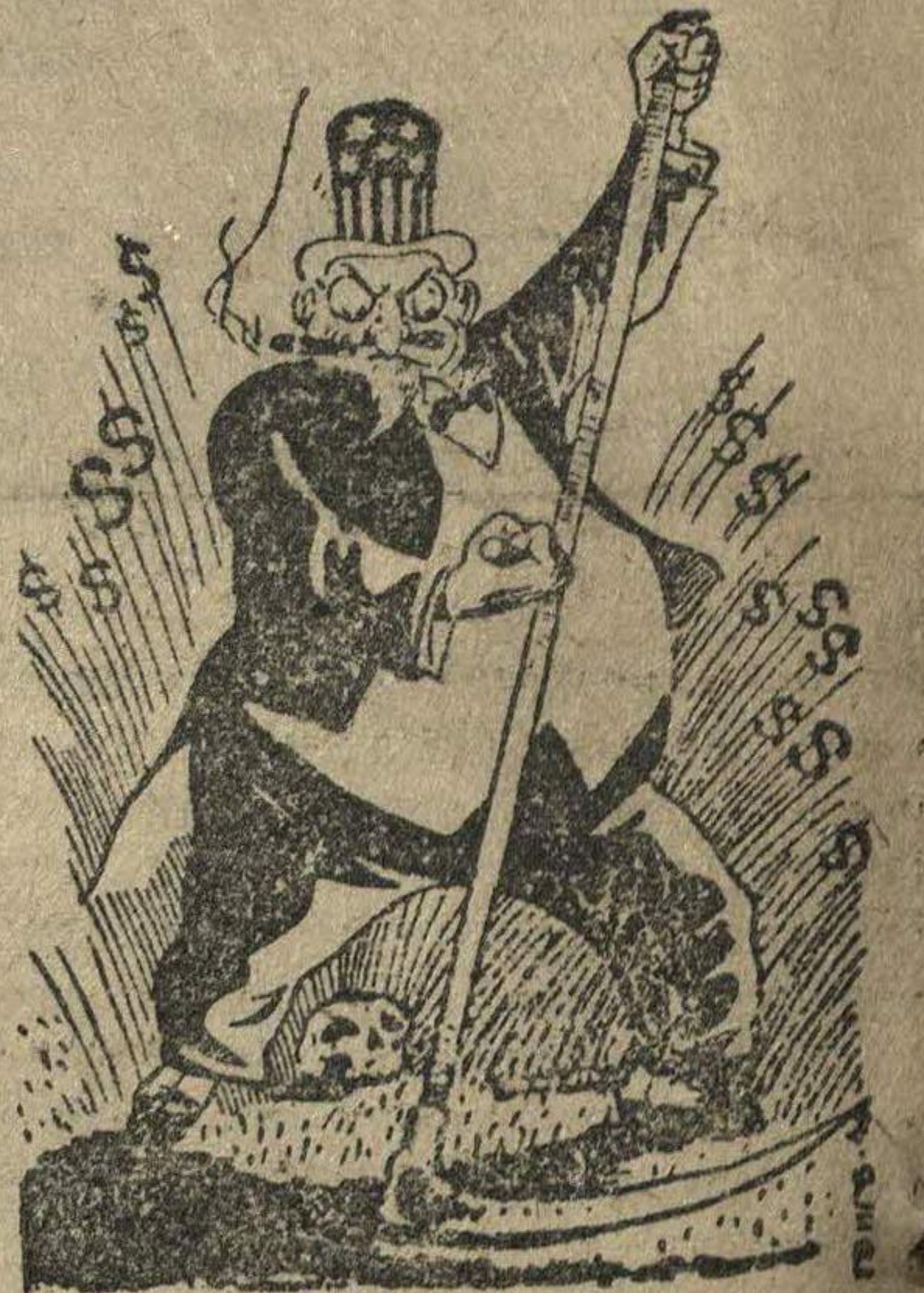
Американские фабриканты оружия на полях войны в Европе.