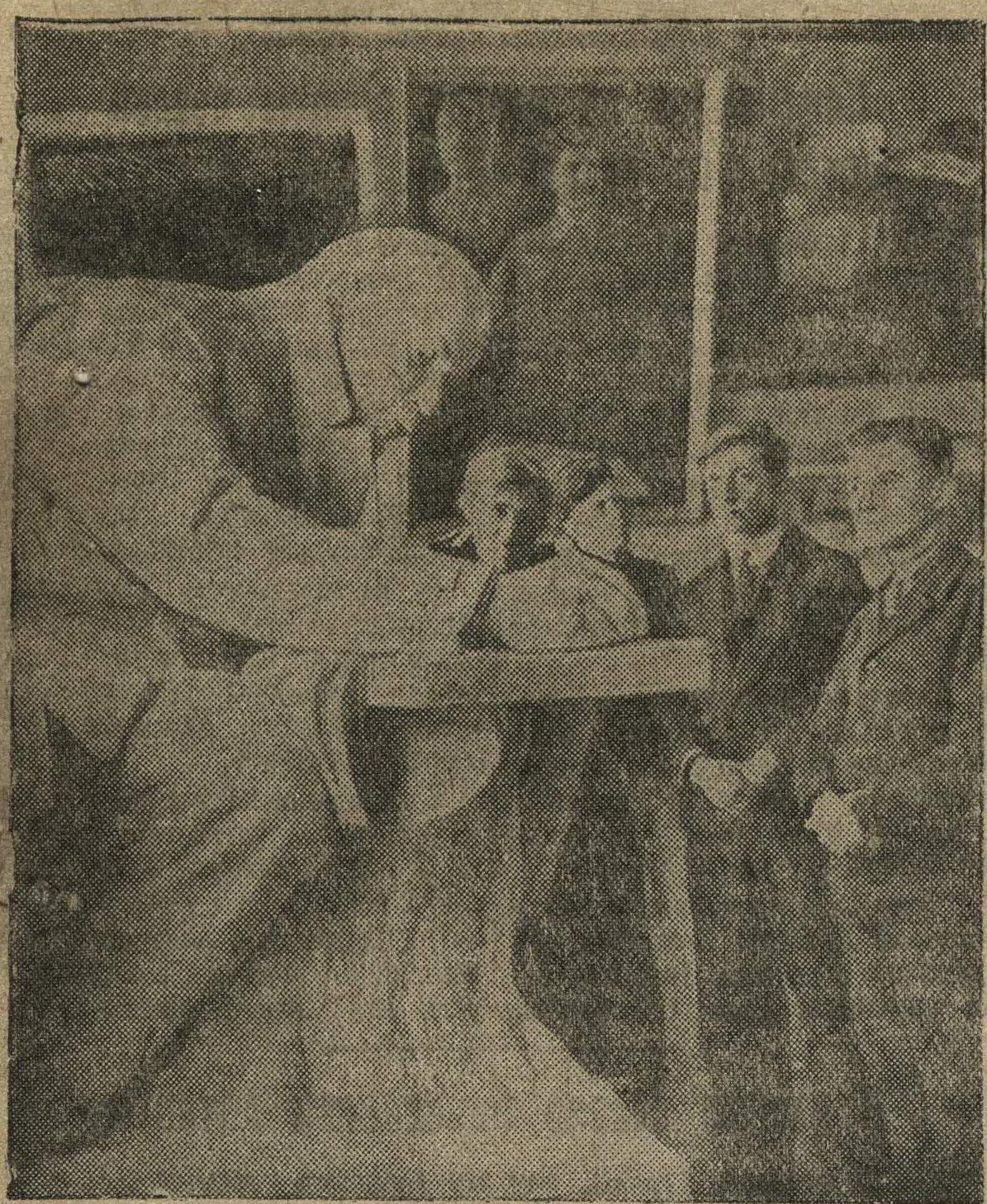
Экскурсанты осматривают скульптуру В. И. Ленина в Советском отделе Днепродзержинского художественного музея.