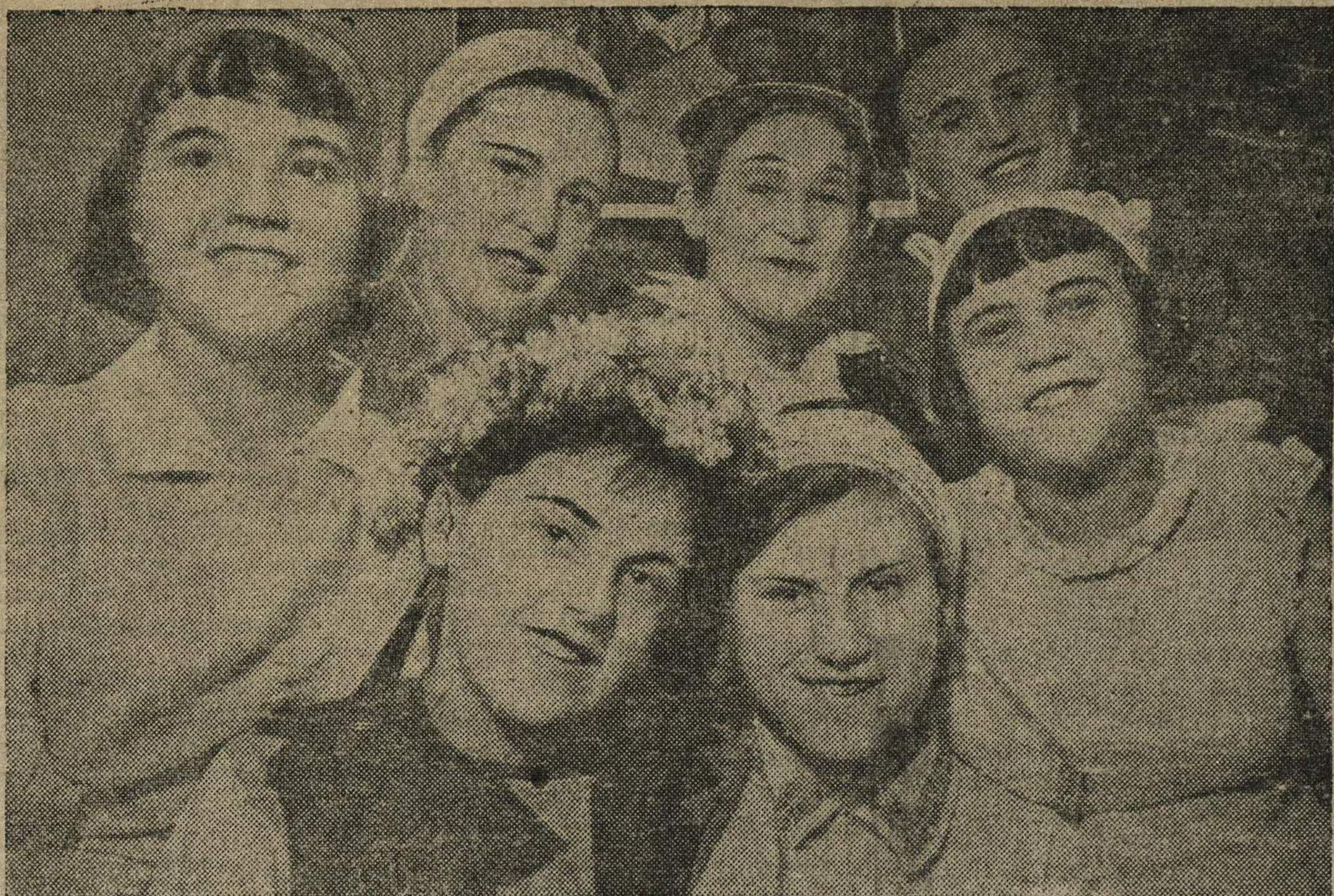
Активисты драматического кружка Центрального клуба автозавода им. Молотова — ученики Автозавода Фото П. Вознесенского.

На экранах Горького также будут показаны фильмы «Личное дело» (сценарий В. Поташева, режиссер А. Разумный) и «Четвертый перышко» (по сценарию Г. Блауштейна и Г. Венецианова. Режиссер П. Эйзенштейн) и «Большая жизнь» (режиссер Л. Луков).