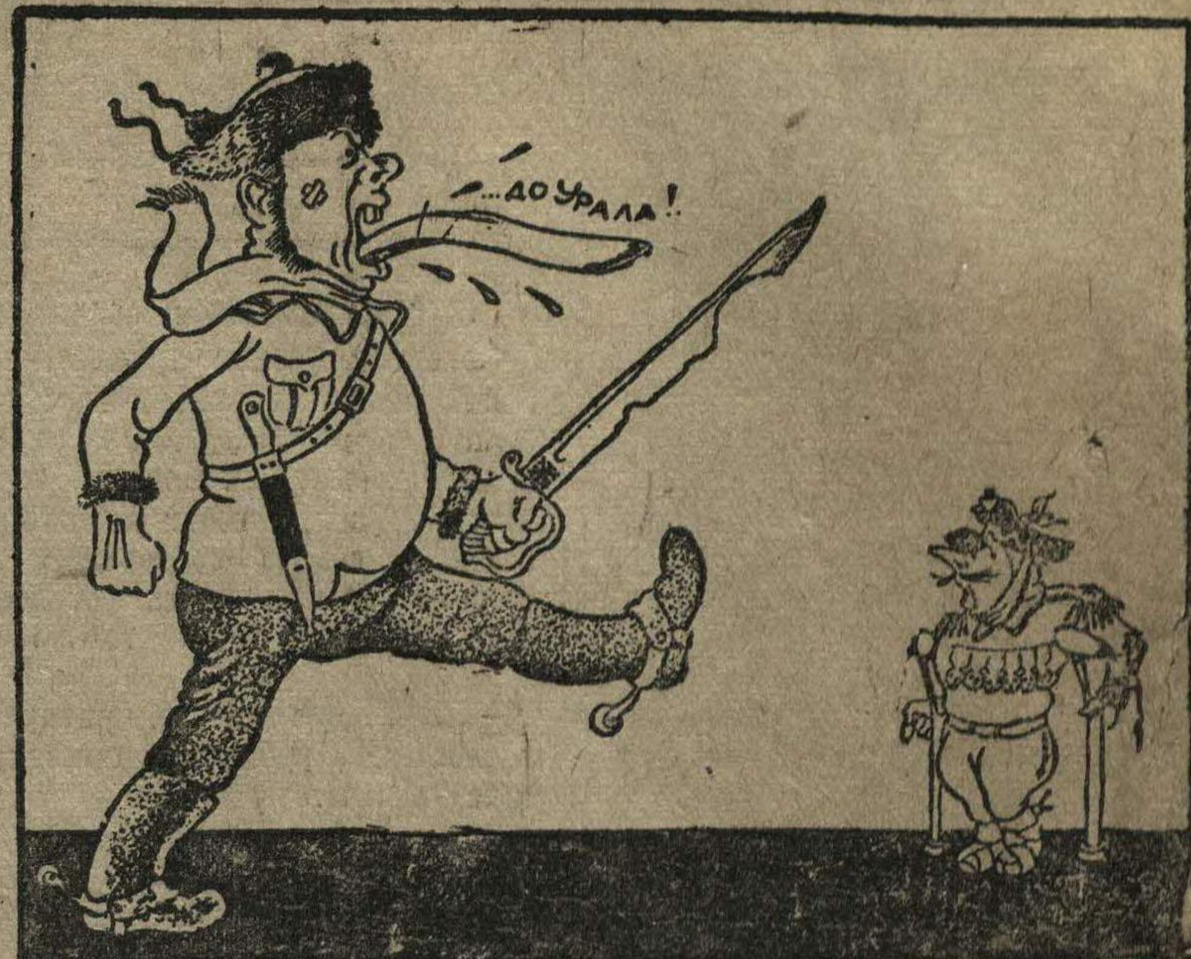
БЕЛОПОЛЯН: Предупреждаю вас, пане, зтот язык в свое время меня даже и до Киева не довел. Рис. Отарова.

Городец — районный центр Горьковской области — живет новой, радостной, полнокровной жизнью.