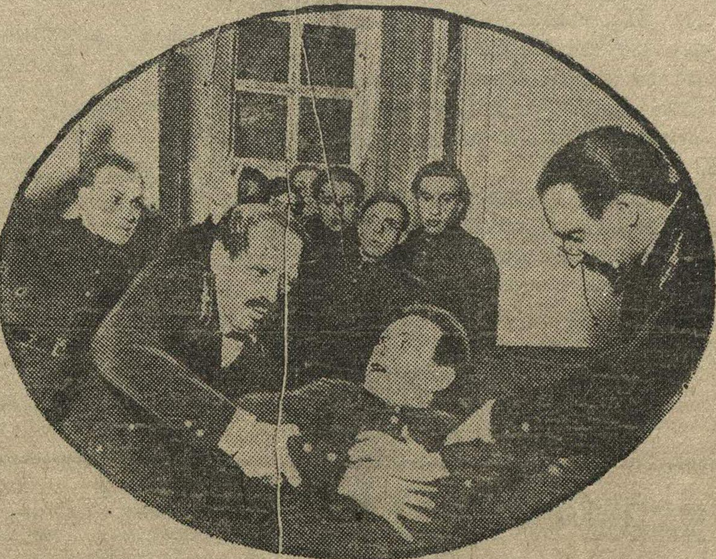
Пьеса «Гимназисты» Тренева в постановке режиссера ВИТАЛЬЕВА идет с успехом в театре Юного зрителя. На снимке: сцена из второго акта — «Обыск в классе».

В отчете IV пленума Горьковского обкома ВЛКСМ, напечатанном в газете «Л. С.» за 10 февраля с. г., допущено искажение речи тов. Силищевой. Во второй колонке начало ссылок обзавла следует читать так: «Наша МТС, — говорит тов. Силищева, — организовалась в 1936 году и за это время было обучено 50 девушек-трактористов» и далее по тексту.