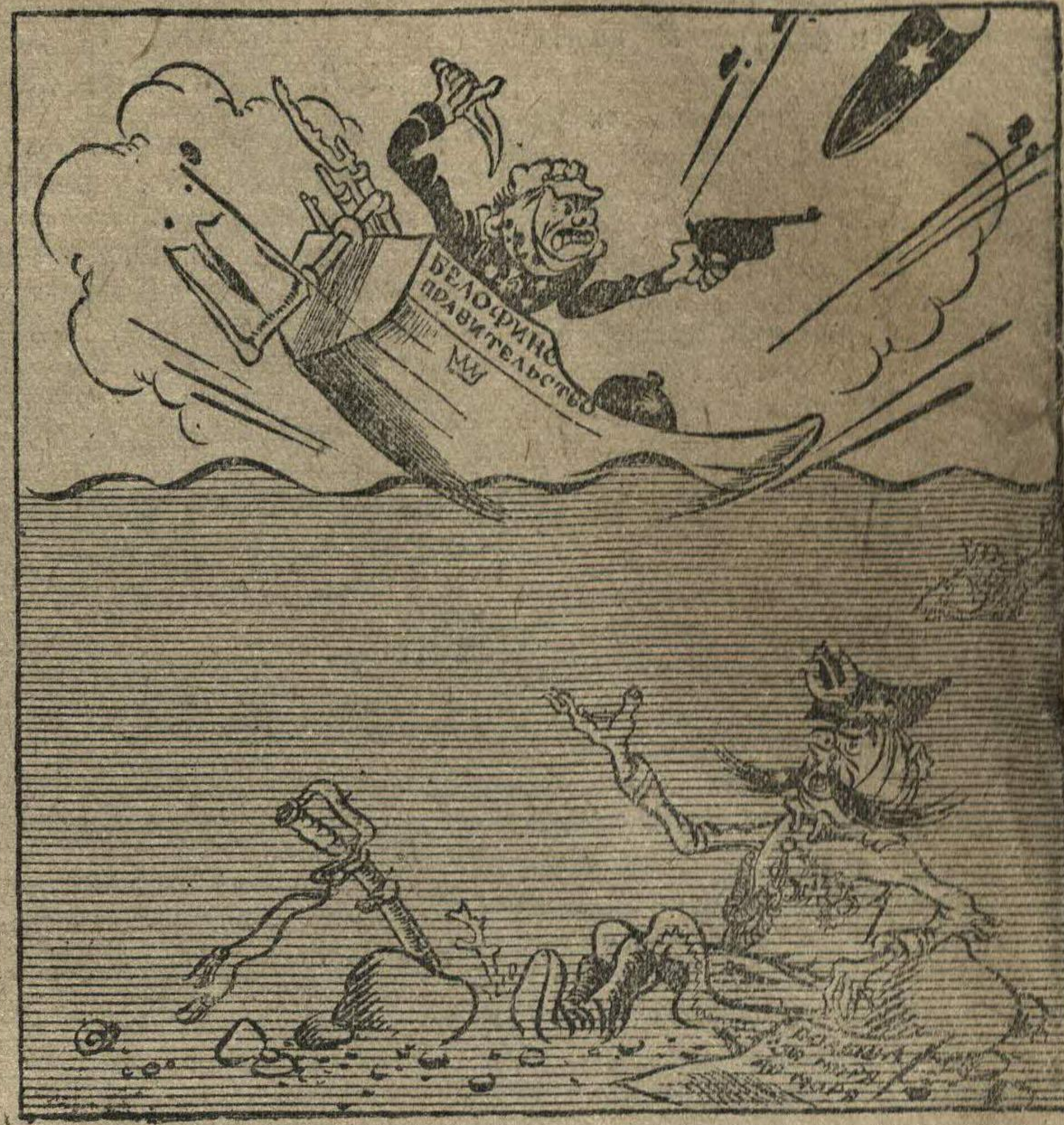
Рыдз-Смиглы (барону Маннергейму) — На теряйте, куме, силы, спускайтесь на дно! Рис. П. Головина.